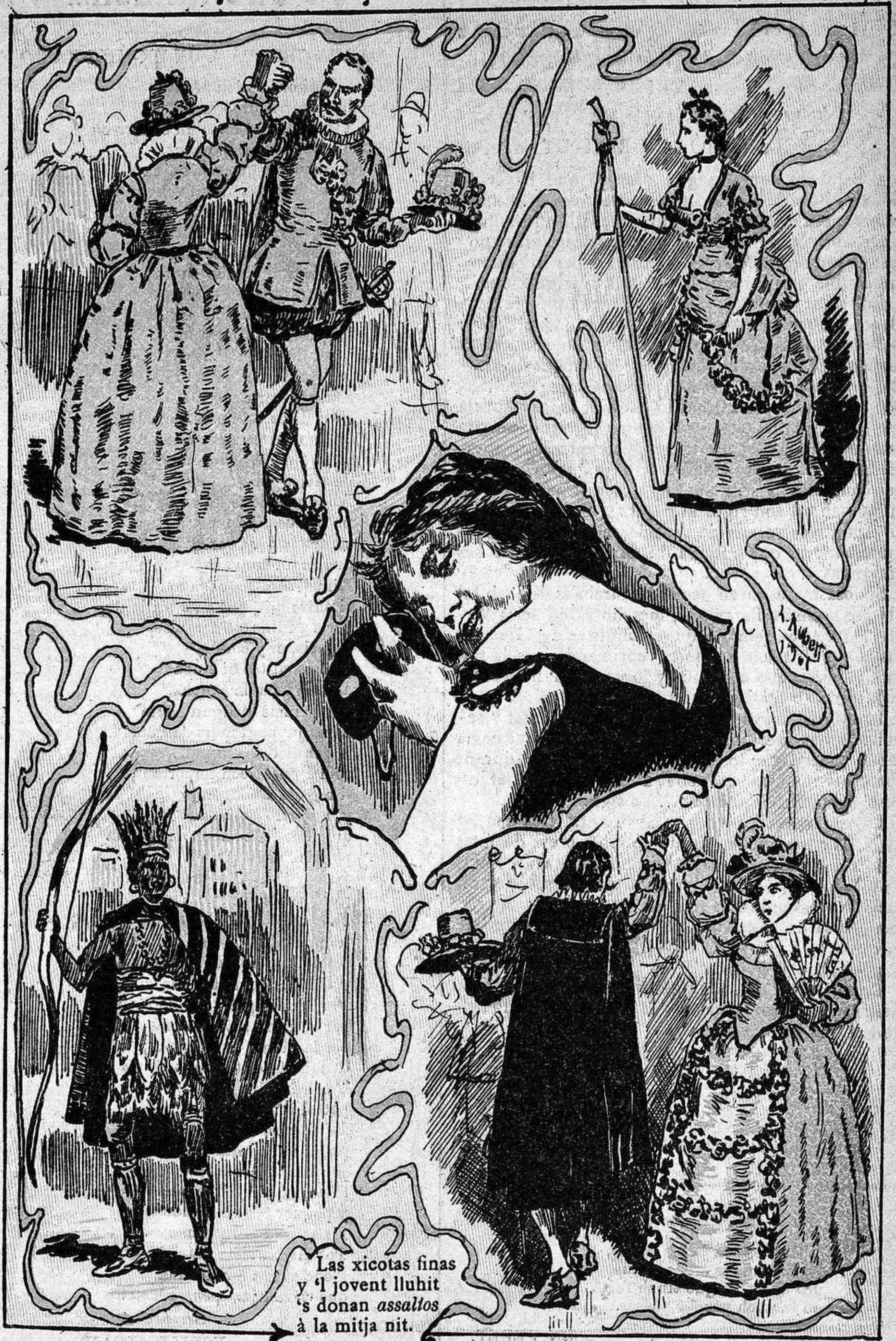
Las xicotas finas y 'l jovent lluhit 's donan assallos à la mitja nit.