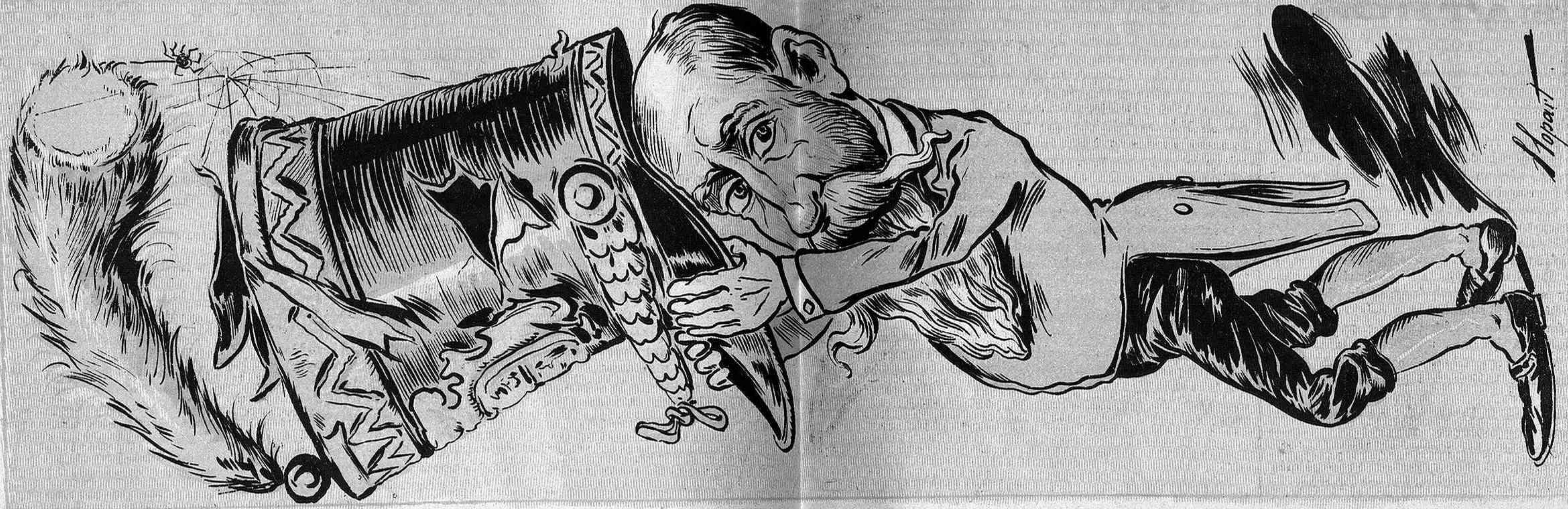
—¡Jo me 'n rich d' el qué dirán! ¡Me quedo ab la fambrera encare que 'm vingui gran!