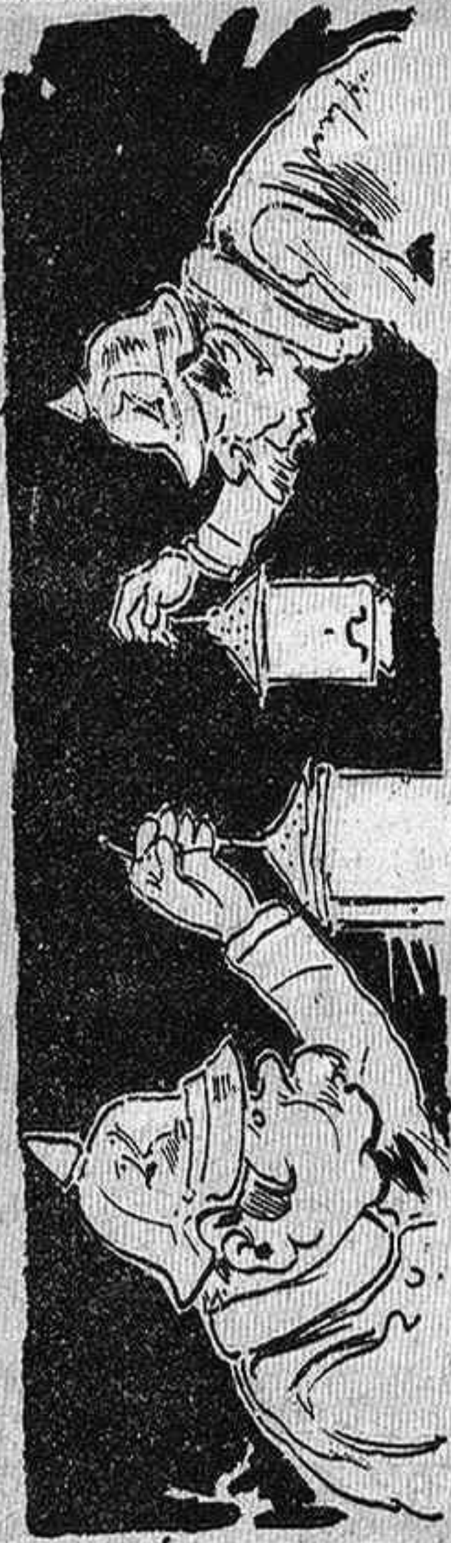
Encare t' buscan ¡jo 't tochi! ¡no 's troba l' honor en lloch!