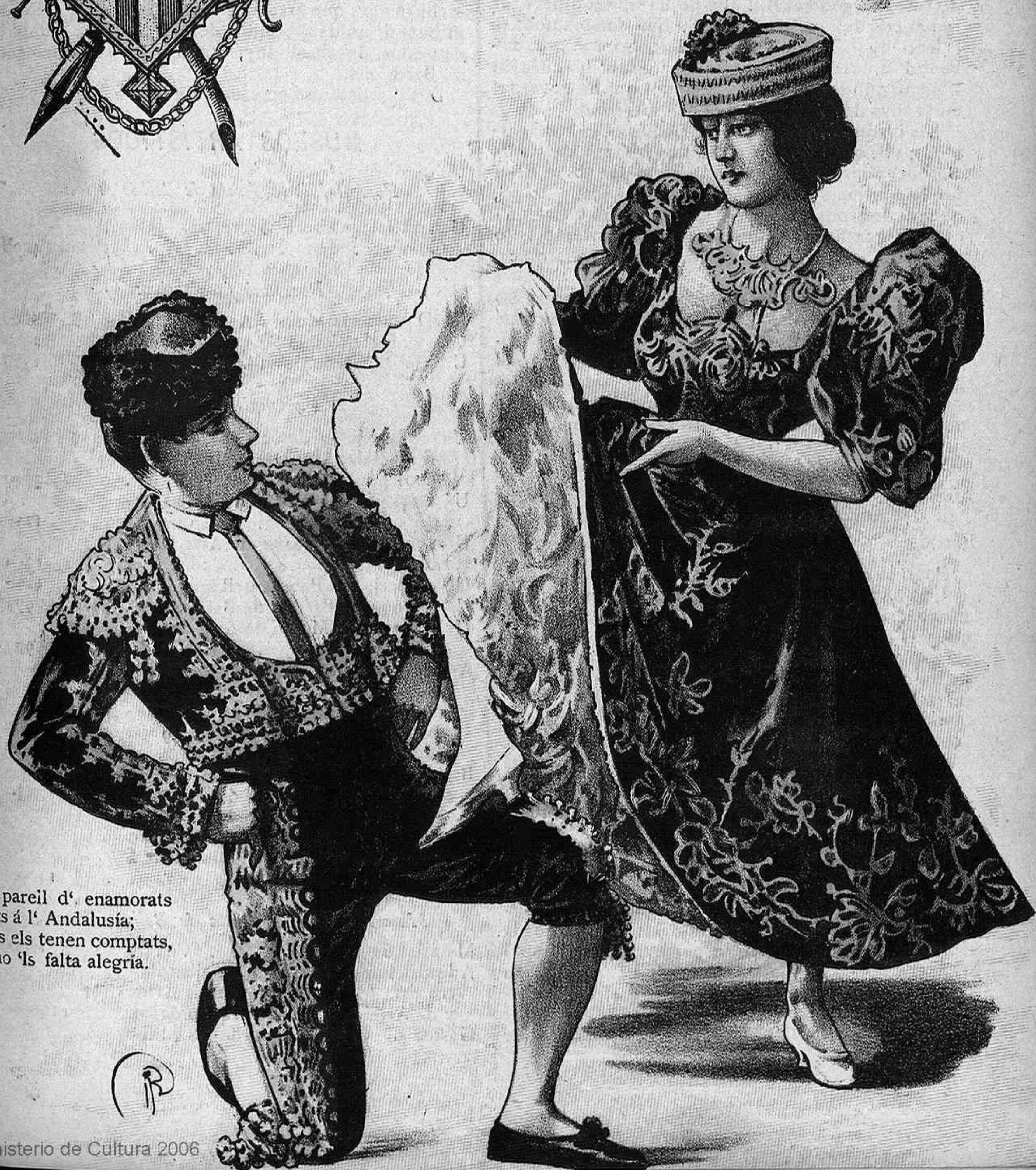
Un pareil d' enamorats nascuts á l' Andalusia; 'ls rals els tenen comptats, pero no 'ls falta alegria.