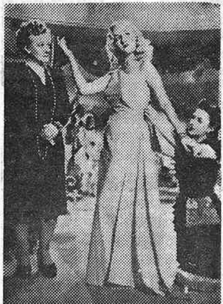
La bellísima Mirtha Legrand en una escena de la magistral película "El retrato", que, presentada por Suevia Films, se proyecta con gran éxito en el Palacio de la Música

La gracia y amabilidad del argumento de "El retrato" justifican el éxito