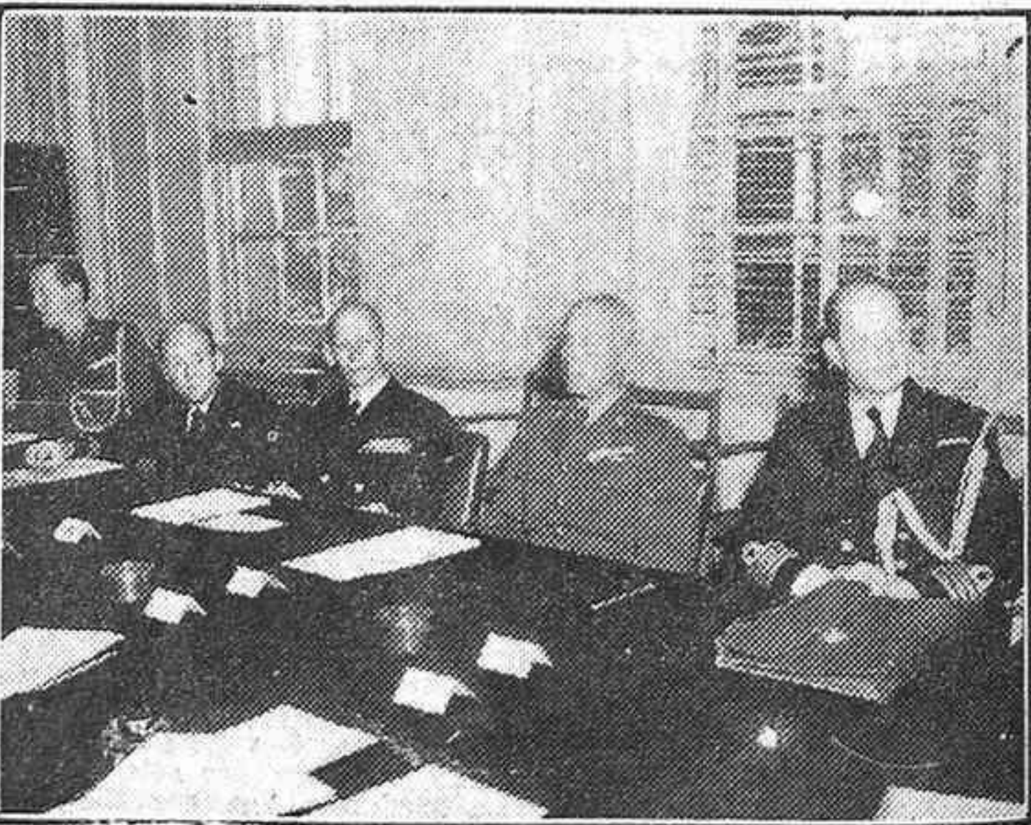
LA MISION DANESA QUE SE HA ENTREVISTADO CON EL PRESIDENTE TRUMAN PARA TRATAR DEL PACTO DEL ATLANTICO DEL NORTE Y EXPONER LOS PUNTOS DE VISTA DE SU NACION RESPECTO A LA DEFENSA COMUN, HA PERMANECIDO VARIOS DIAS EN LONDRES. LA MISION ES PRESIDIDA POR EL PRINCIPE JORGE DE DINAMARCA