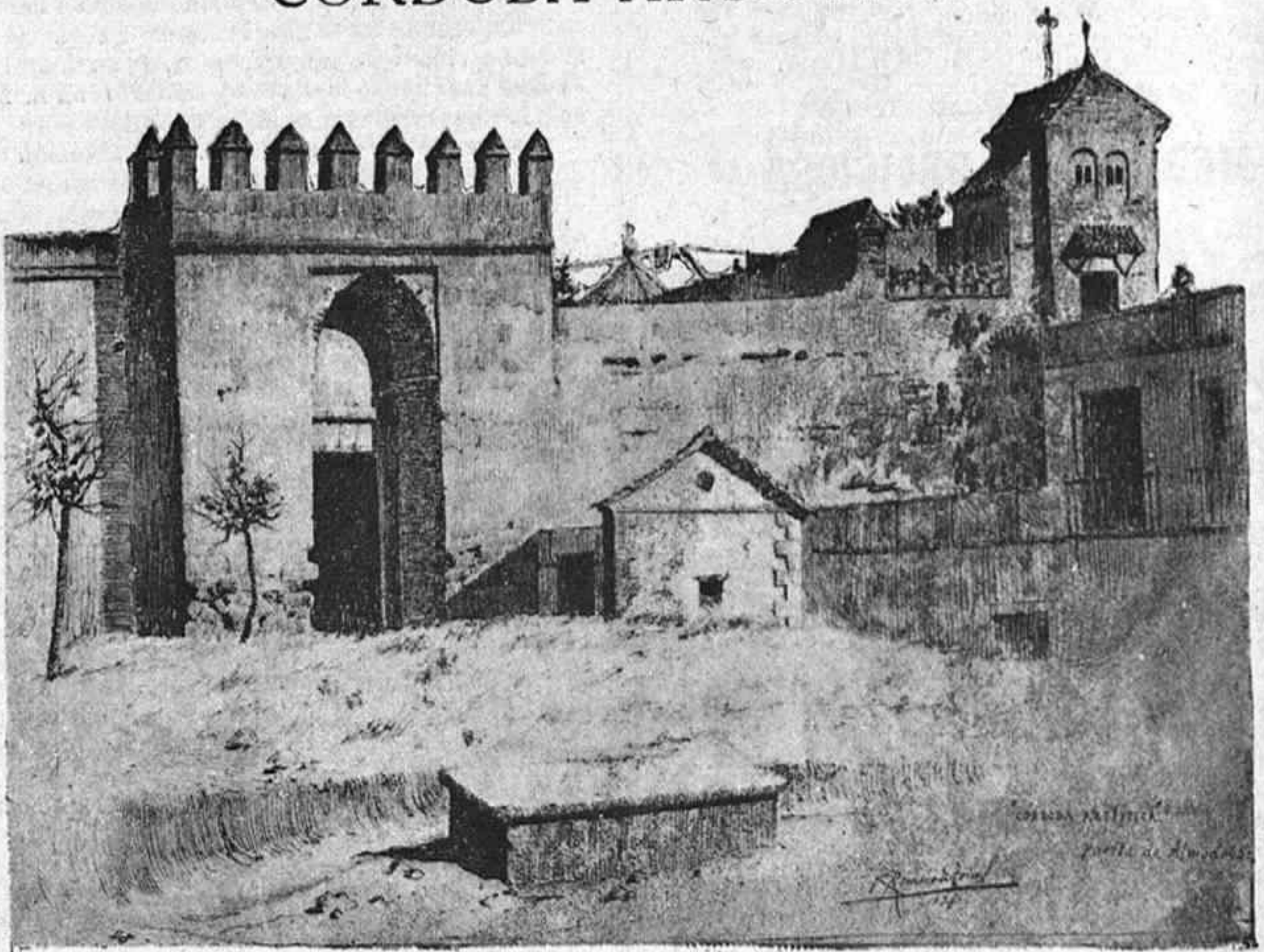
PUERTA DE ALMODÓVAR, POR ROMERO DE TORRES.