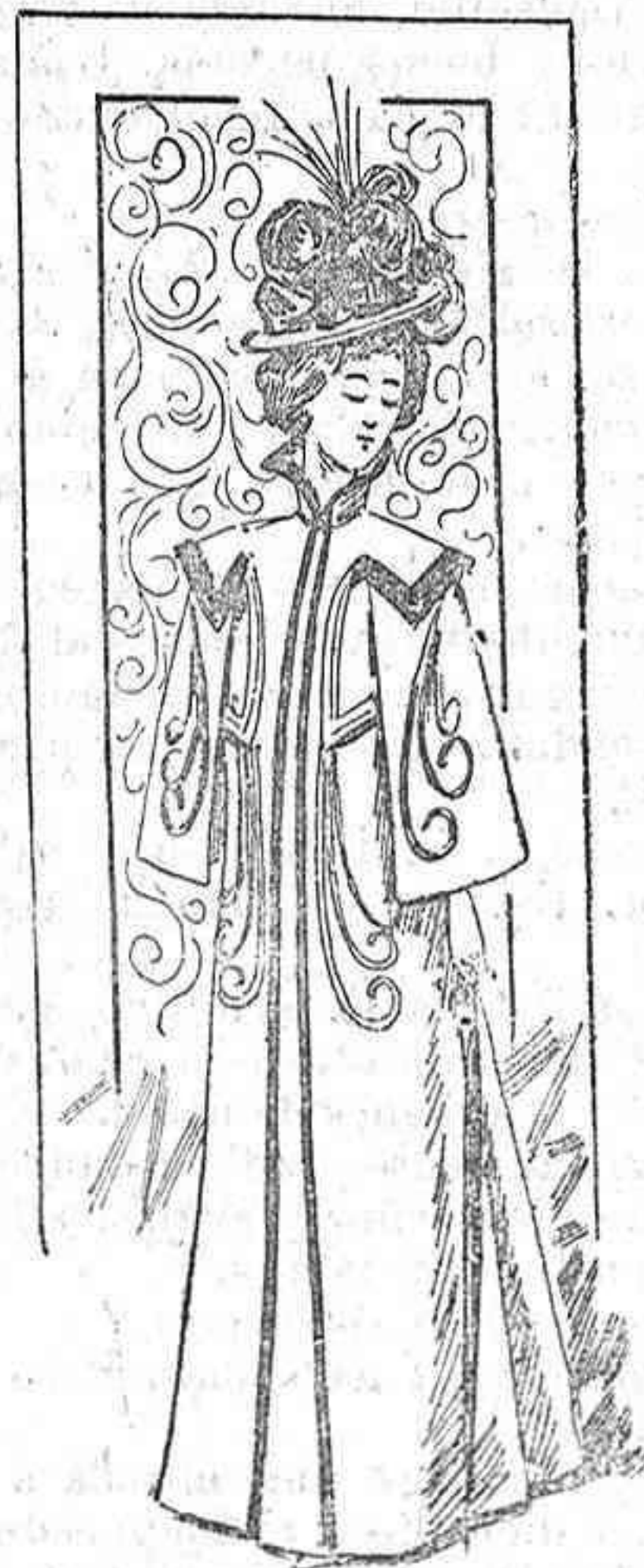
Abrigo largo para señora

Modelo exclusivo para nuestras lectoras, de los Almacenes de EL SIGLO, Barcelona.