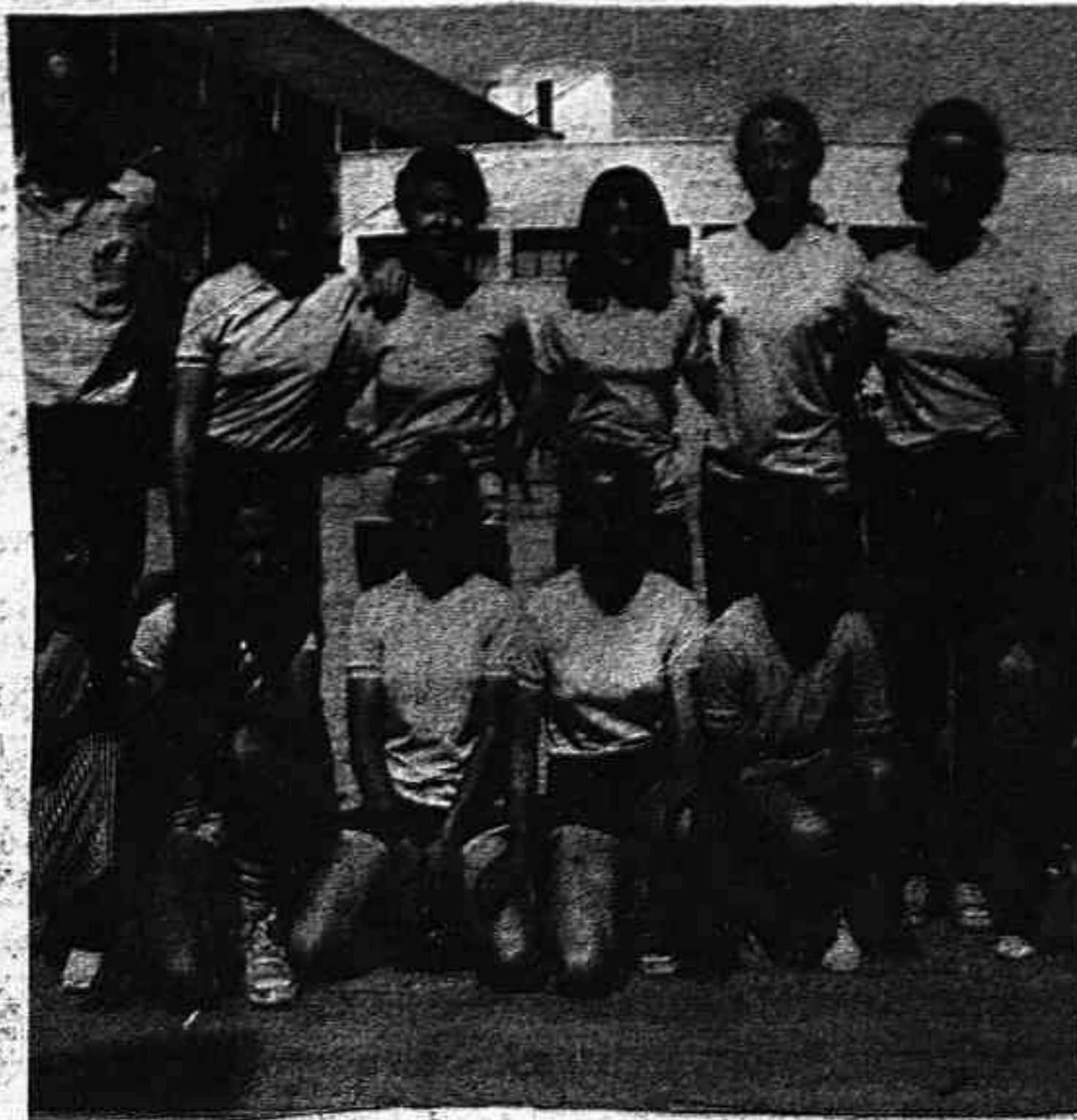
El equipo alevín femenino de Minibasket del Colegio Nacional Virgen del Carmen, de Cox, campeón provincial de esta categoría al vencer en la final provincial de los Juegos Escolares disputados hace dos semanas en el Colegio de los Agustinos de Alicante, al Colegio Paulas de Alcoy, por 37-13.

Hasta llegar a la final, el conjunto derrotó a los equipos de Torre Vieja Orihuela, Alcoy y Alfaz del Pi.