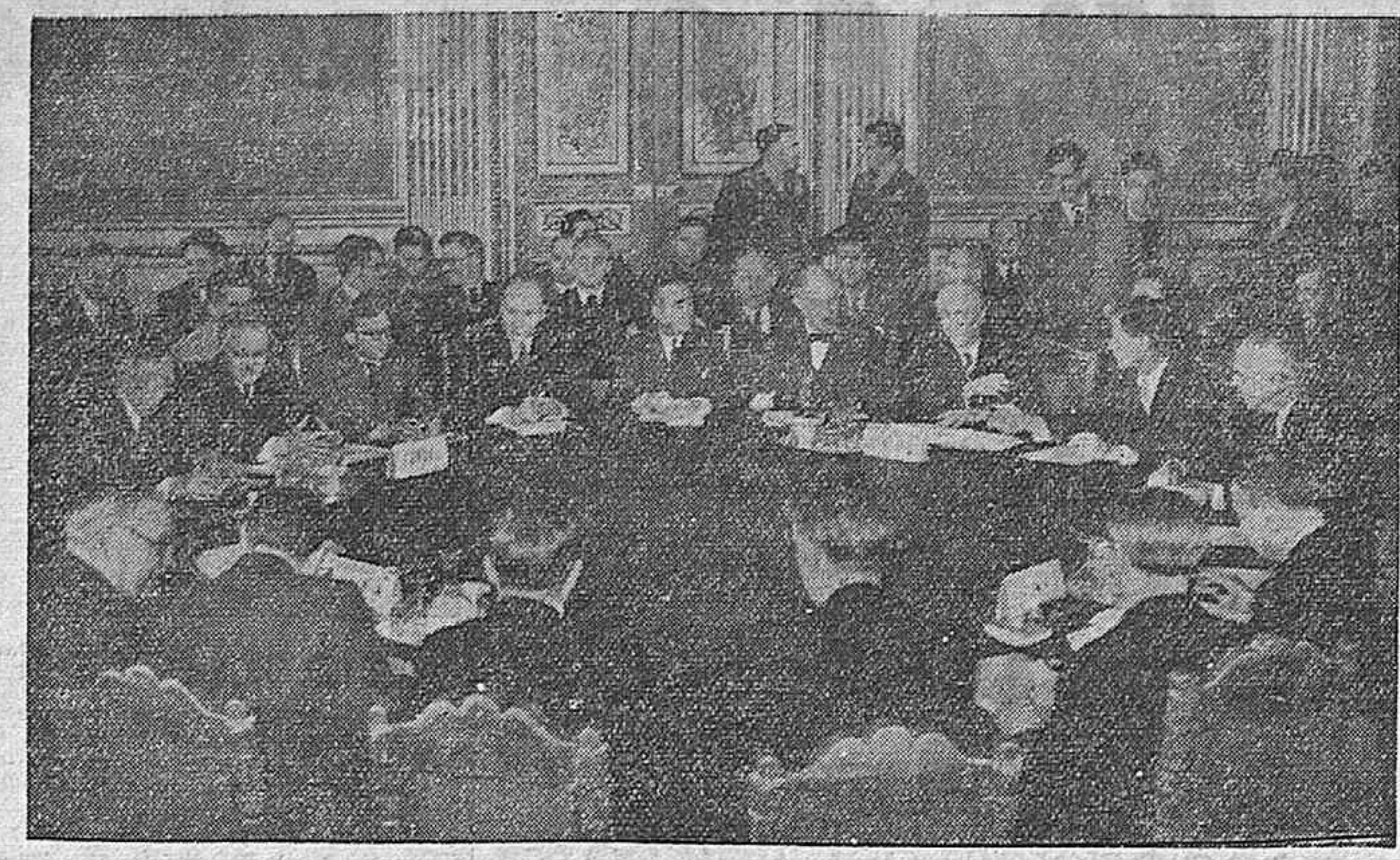
Una de las sesiones de la Conferencia de los Cuatro que actualmente se celebra en París.

El pasado sábado día 22 se ha puesto a la venta en Francia el primer número de un nuevo semanario, impreso en huecograbado, con el título de «Vie Sovietique».