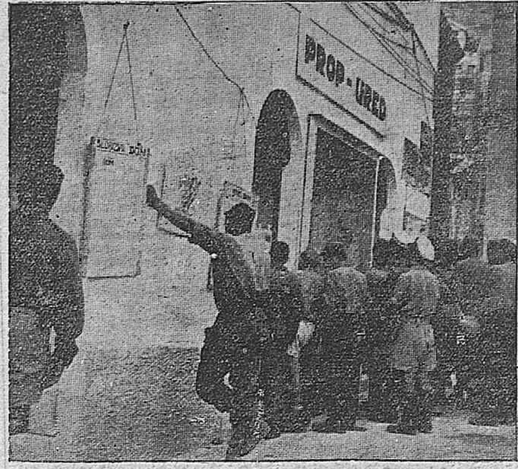
En la nueva Yugoslavia, soldados y campesinos leen en una aldea los bandos fijados por las autoridades libremente elegidas por el pueblo.