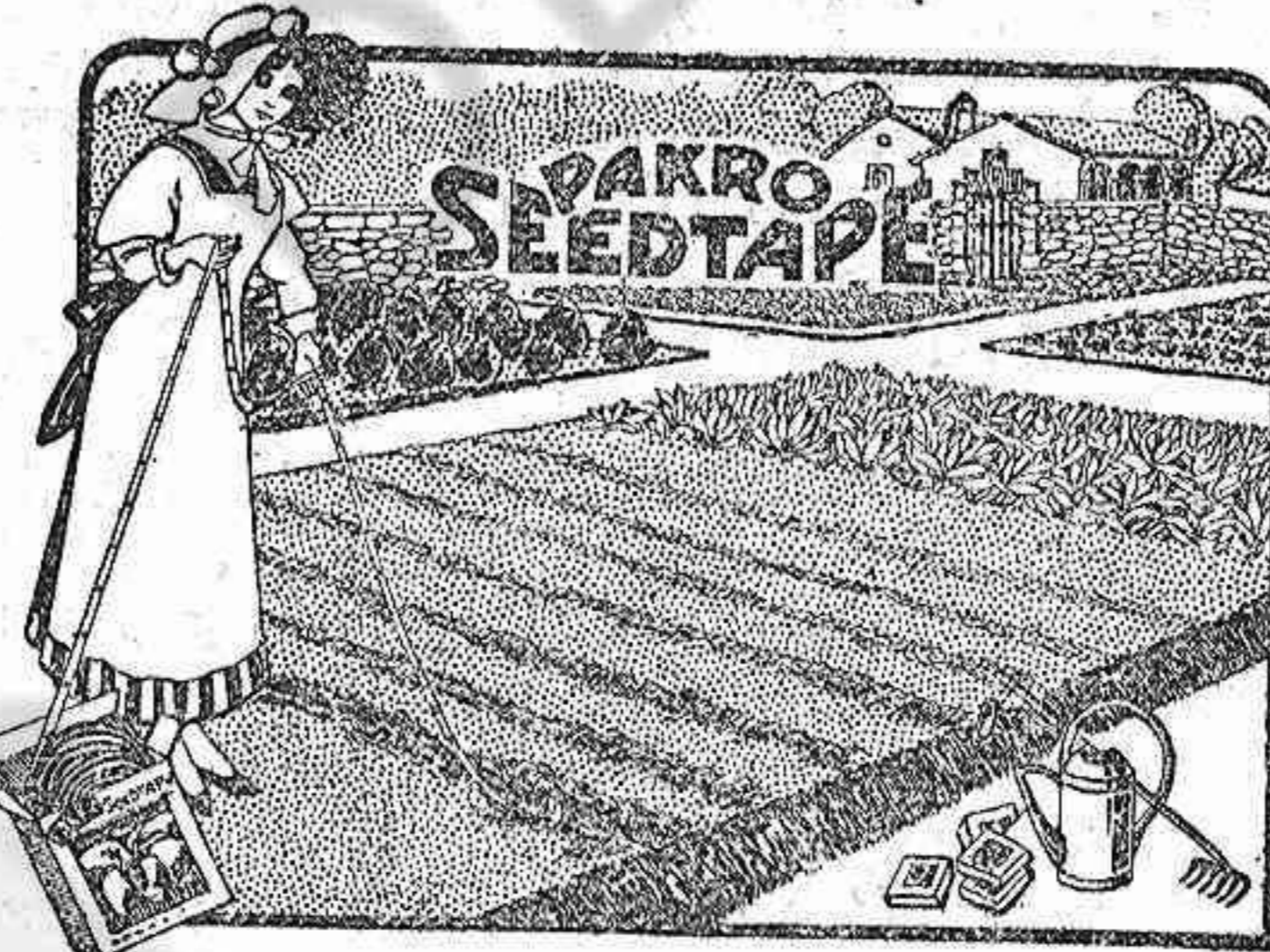
48 variedades de Hortalizas 30 variedades de Flores. Las mismas variedades pueden pedirse en semillas sueltas.

CONSULTORIO JURIDICO-ADMINISTRATIVO Y AGENCIA GENERAL DE NEGOCIOS Obispo Aguirre, 2, bajo.—LUGO.