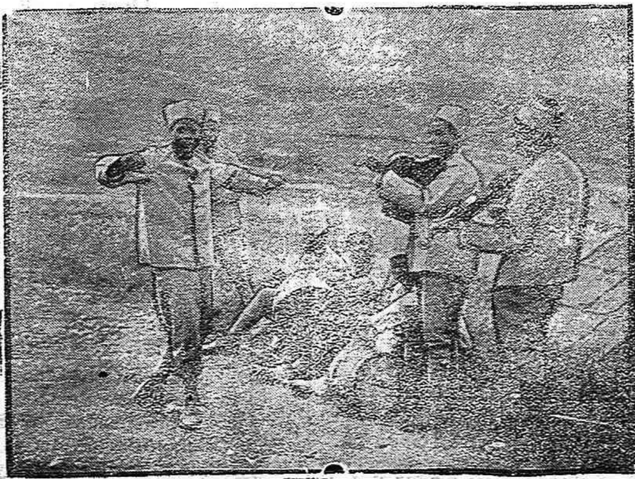
De la guerra.—Recordando la Patria

El Consejo superior de Emigración propo-