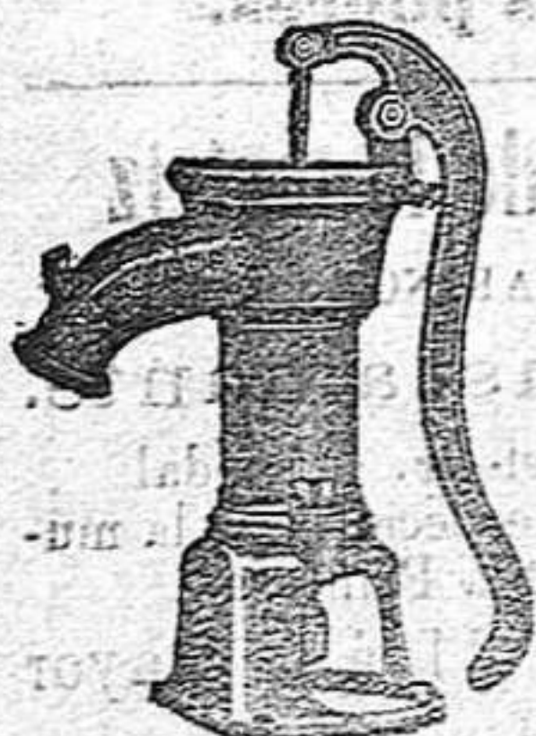
BOMBA PARA RIEGOS

Construye con solidez, economía y adelanto.