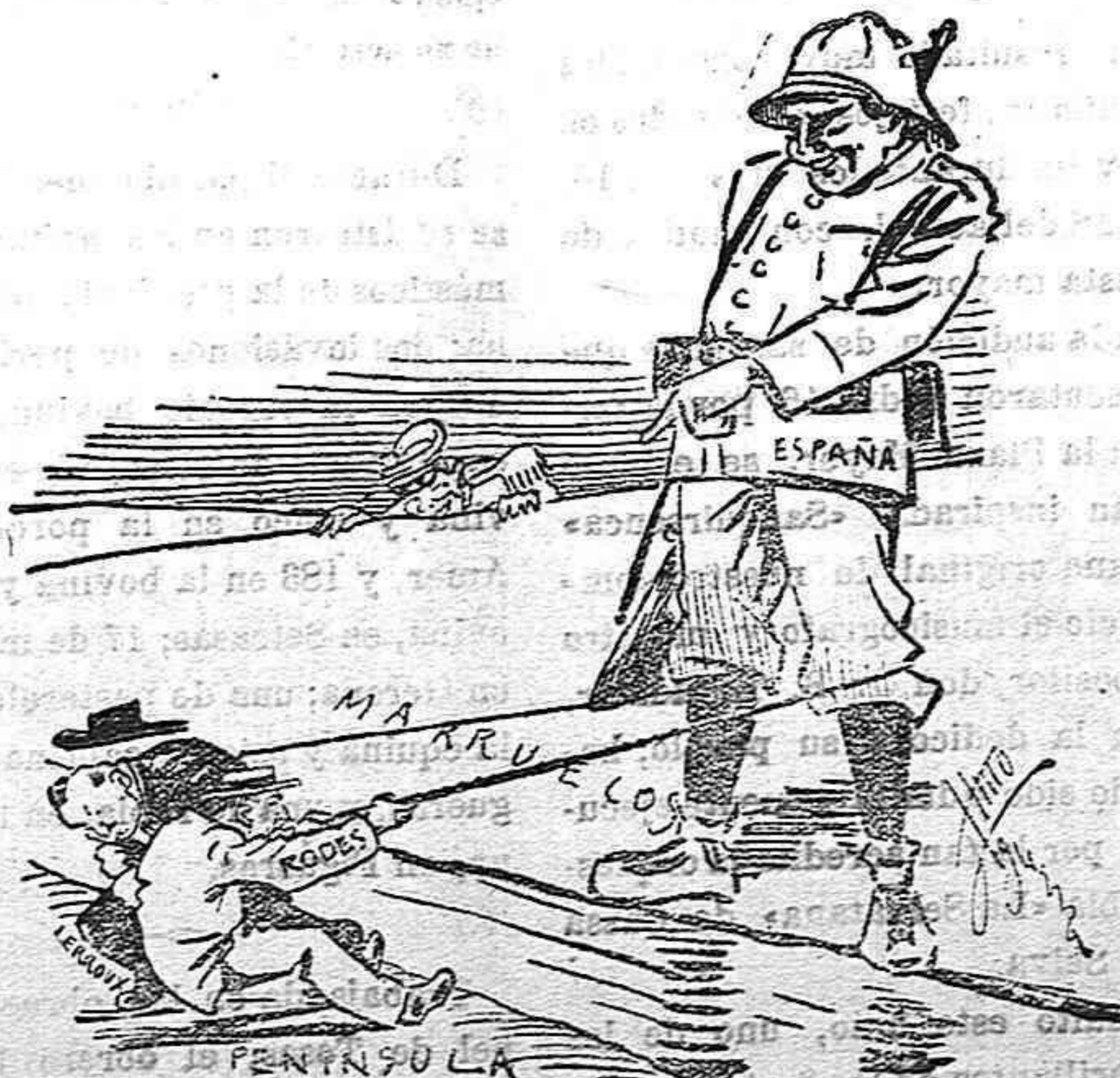
LA FUERZA REPUBLICANA

Desde hace algún tiempo el Gobierno y la opinión pública de Grecia sentían gran despecho por los malos tratamientos que los otomanos infringían a las colonias helénicas de Anatolia. Sin cesar llegaban a Atenas sensibles noticias y pesi-