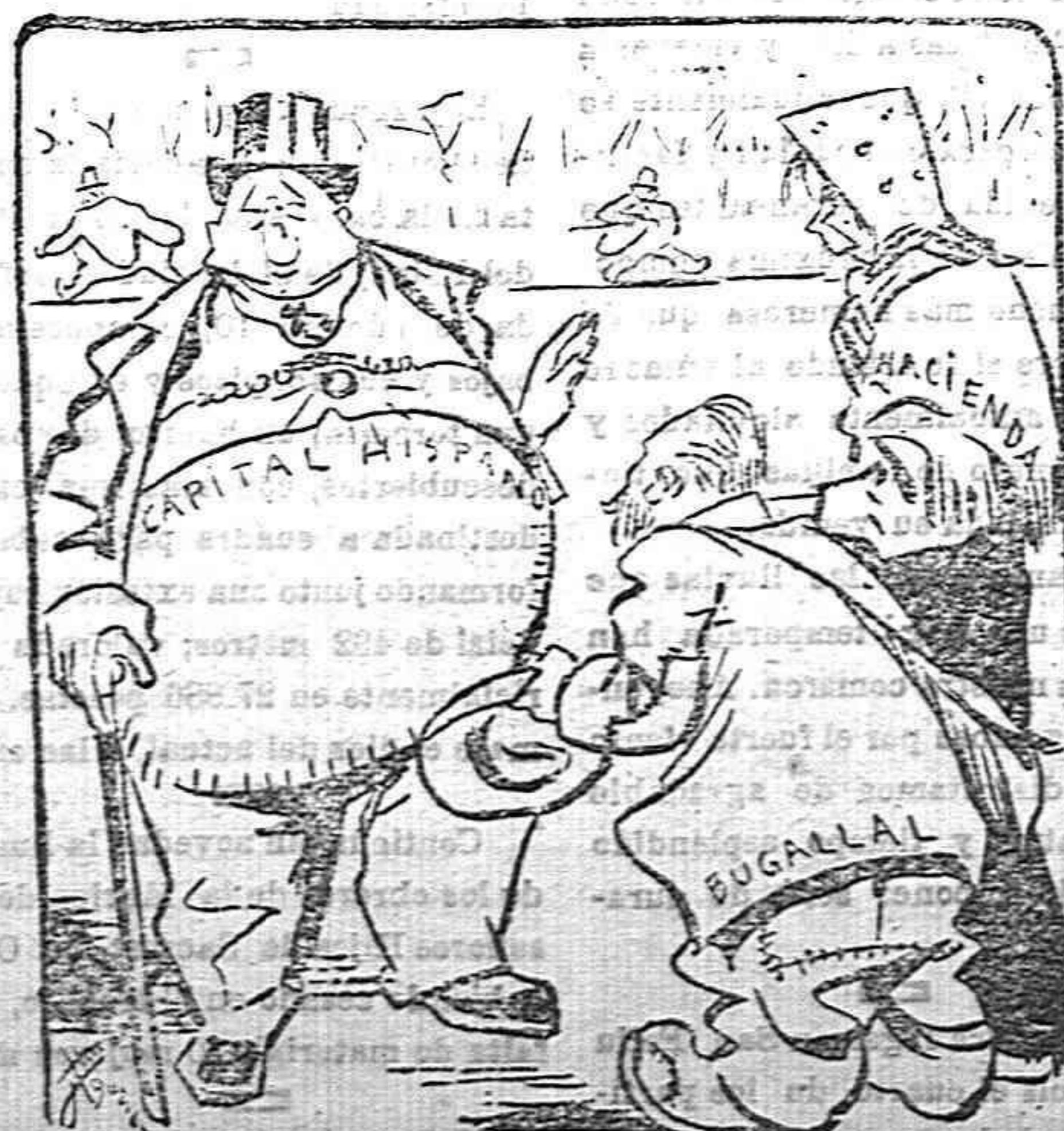
Bugallal.—Señor, déjenos algo para ayuda de un empréstito. Capitalista.—Perdonen hermanos, que no llevo encima más que papel... extranjero.