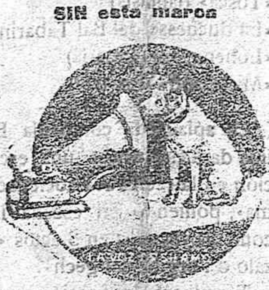
el aparato NO es un GRAMÓFONO Catálogos gratis

Calle Mayor, 22. - REUS. - Despacho, 4, pral.