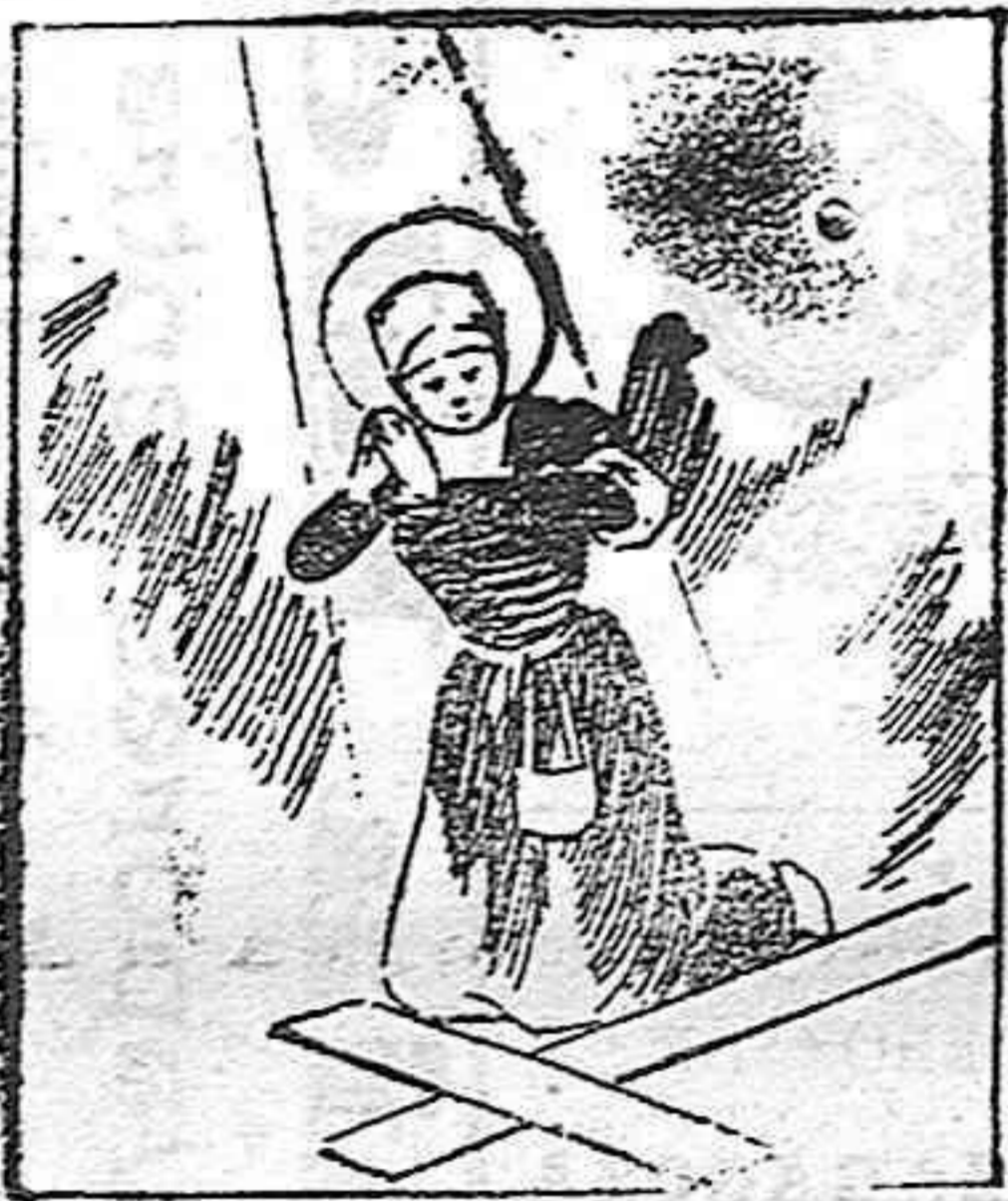
Martirologio: LA BEATA MARIANA DE JESÚS.

El Buen Pastor, y la Beata María Ana de Jesús.