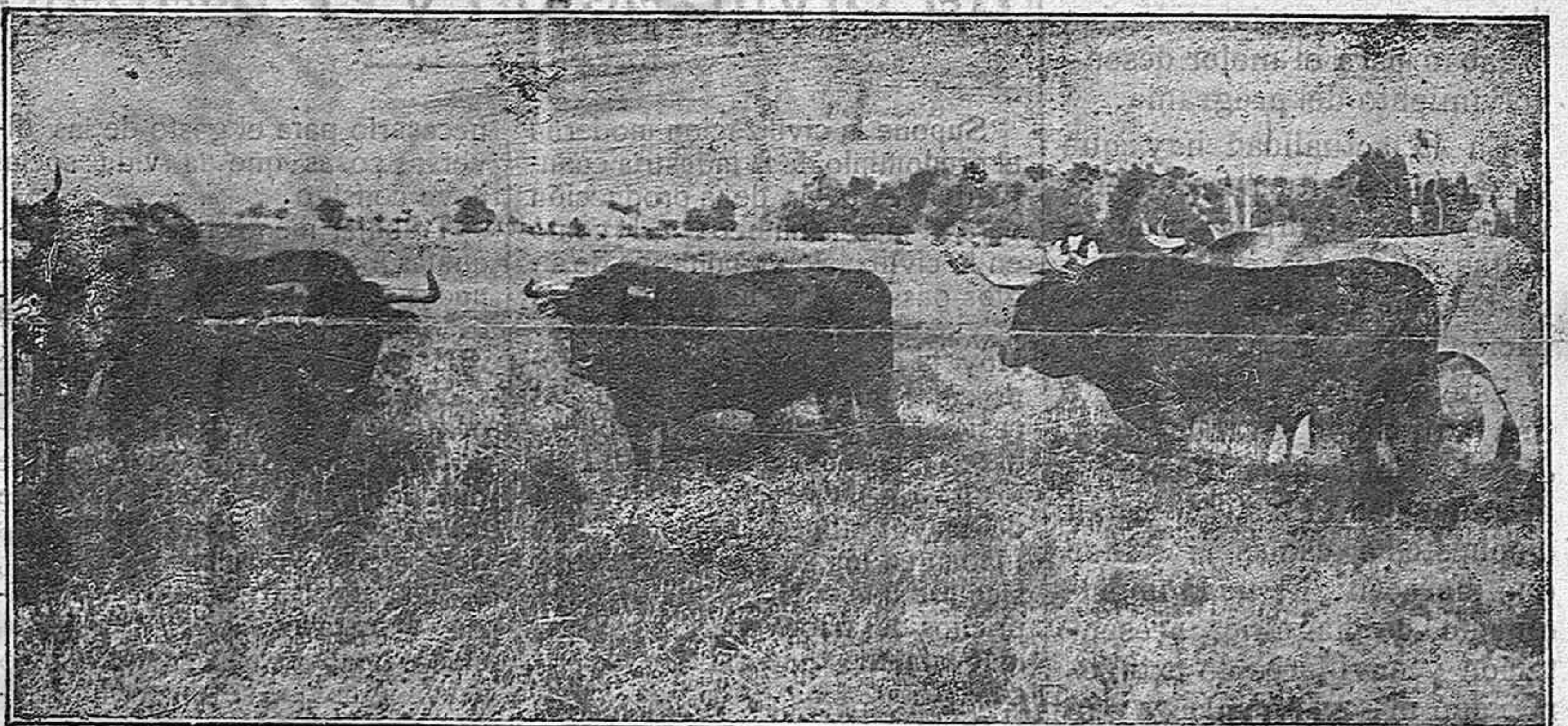
Algunos de los toros que han de lidiarse en las Fiestas

Del toro una tajada Para cada vecino hay destinada. Al cerrar de la noche, iluminado Se ve un Santo en la casa del Jurado. El Santo titular és: con gracejo En plácido festejo, Se agita alegre danza, Que rebervera amor y bienandanza. Para la nueva aurora ¡Oh maravilla! El resto de la rés cada cuadrilla. Aderezada pone en su caldera Entre manjares mil: de primavera Las matizadas flores, La prestan sus perfumes y colores. Las dieciseis calderas así ornadas En andas, las cuadrillas, colocadas A la Dehesa conducen con su gran pompa, De su fama es la trompa El eco de los pifanos sutiles Mezclado con sonoros tamboriles. Ya las cuadrillas procesion formando Al campo van llegando: Una vez todas en la gran pradera Y ordenadas después con su caldera, La autoridad aguardan oportuna Que pruebe la vianda una por una. Este ceremonial ya practicado Cada cuadrilla el sitio ha preparado Para el repartimiento Del manjar sazonado y succulento. Del ramaje a la sombra Danzas hay mil sobre la verde alfombra. Y reina la alegría. Con la fraternidad y la armonía! Después, en dulce canto, Marcha cada cuadrilla por su santo;