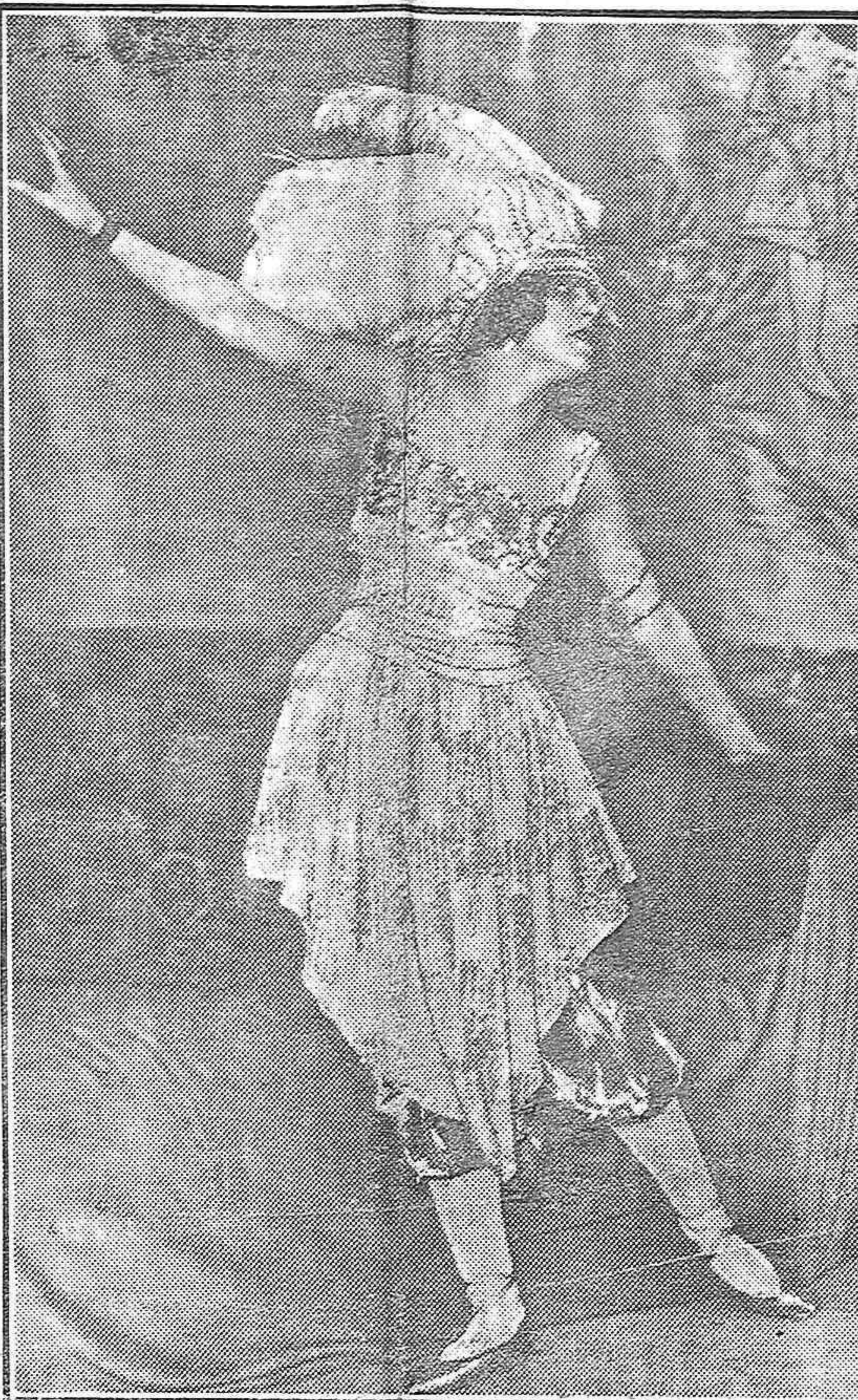
La fumadora de opio en una de las danzas de «El Príncipe Carnaval», que se estrenará mañana en el Nuevo Teatro.