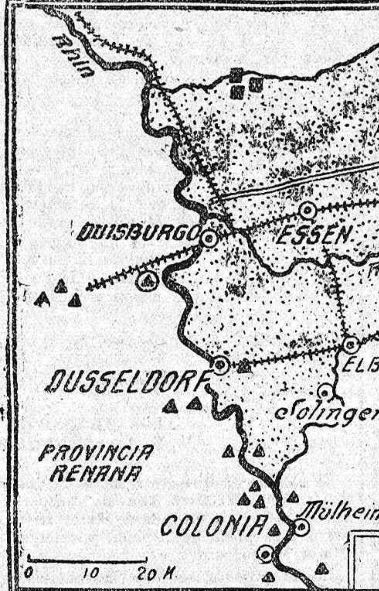
La zona punteada del gráfico será la que ocuparán las tropas francesas.

marchar desde los tres puntos de partida indicados con bastante facilidad, pues los caminos, las carreteras y los ferrocarriles abundan por todas partes. «Estamos en 1913», le preguntaba yo a Ludendorff hace meses en la coquetona villa que habita cerca de Mue-