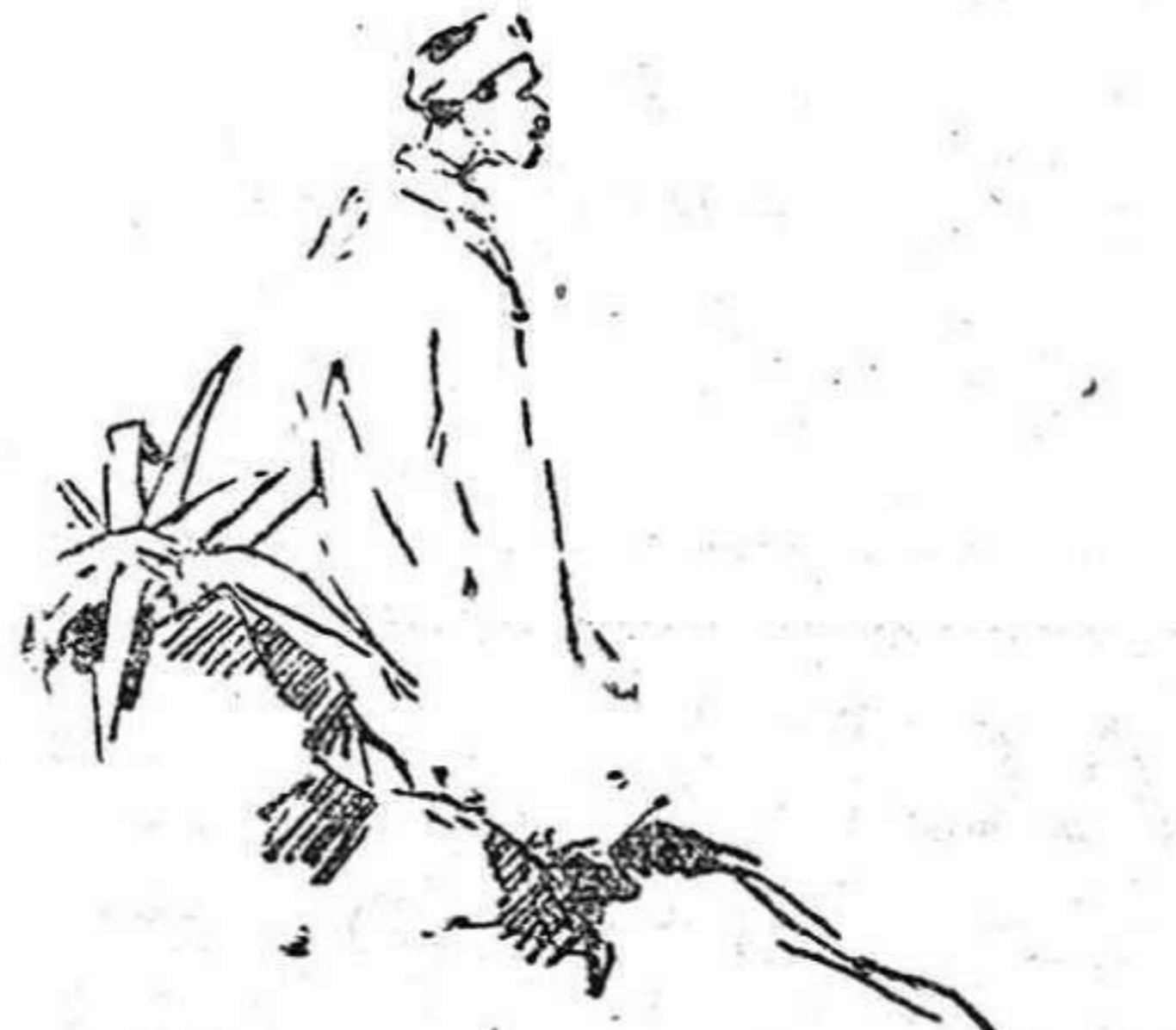
Ilustraciones de MARTINEZ DE LEON

LEAFIELD, 31.—Lloyd George ha sido invitado para pronunciar una serie de conferencias en los Estados Unidos.