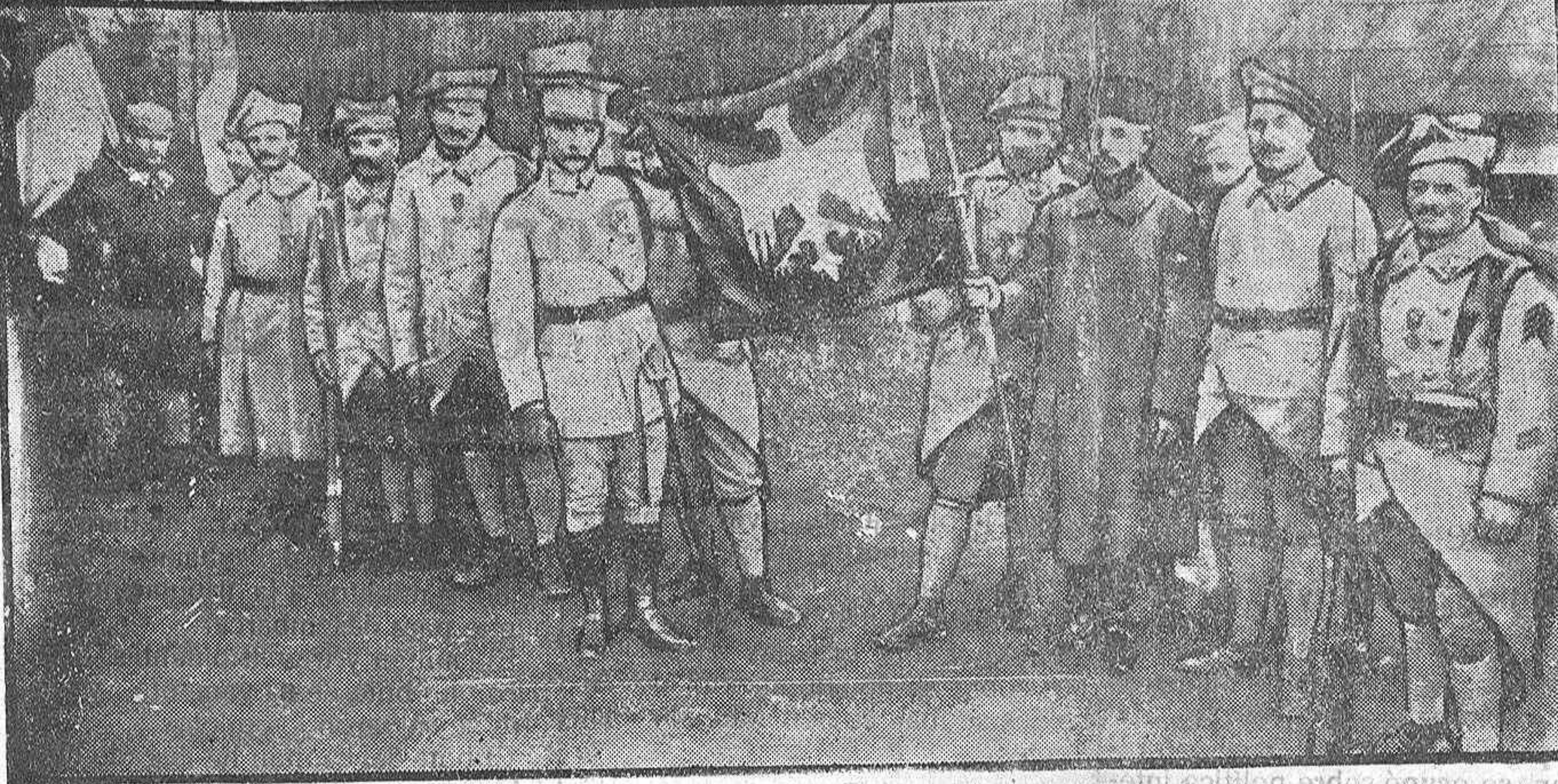
BANDERA DE LA LEGIÓN POLONESA EN FRANCIA