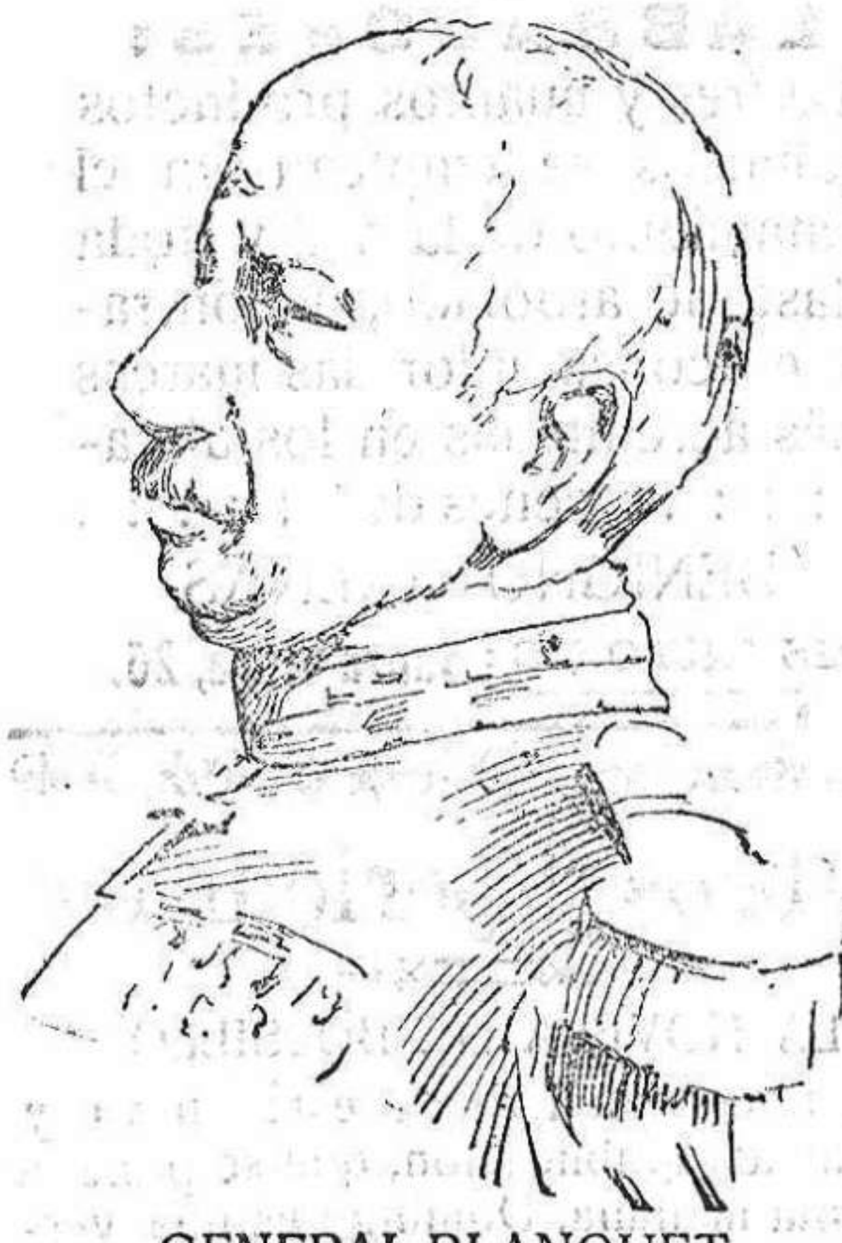
GENERAL BLANQUET, Ministro de la Guerra de Méjico.