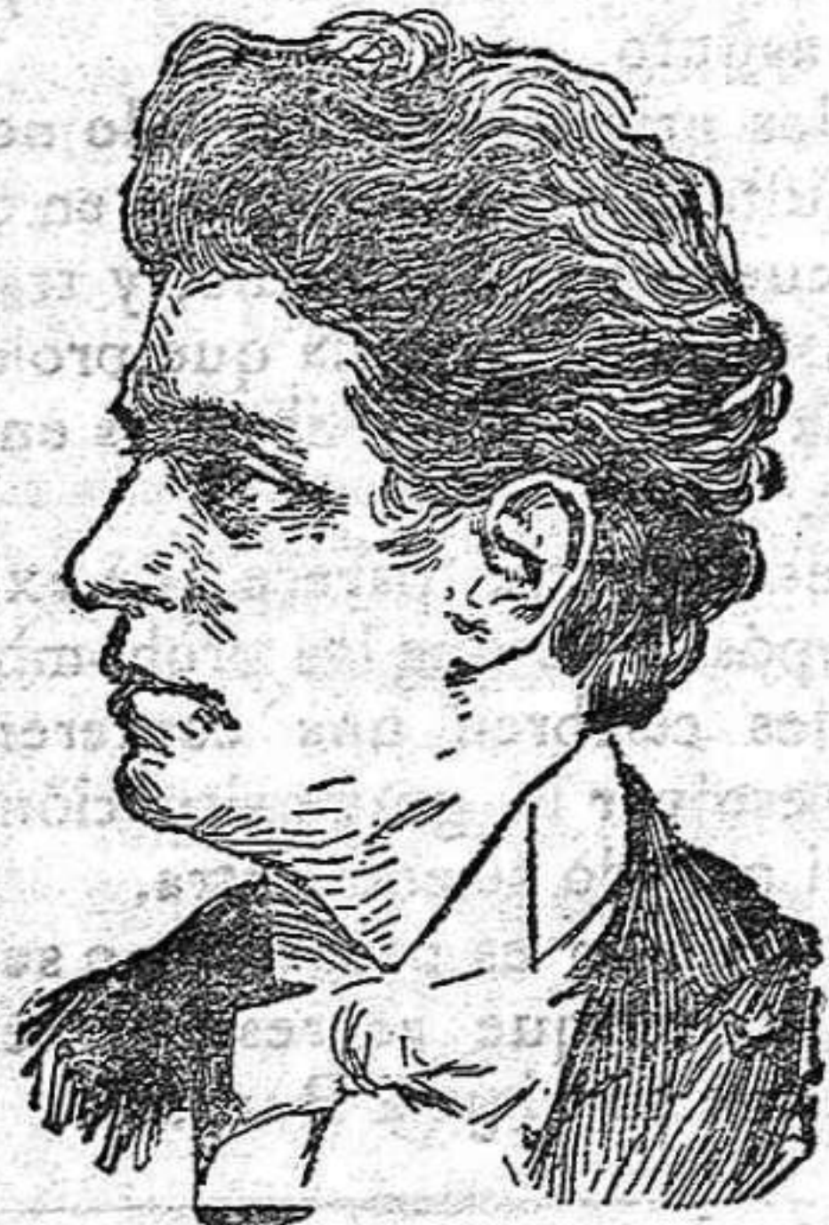
El maestro Mascagni.

En el teatro Liceo de Barcelona, se ha verificado últimamente el estreno de la ópera en tres actos Amica , música del genial compositor italiano Pietro Mascagni, autor de Caballería Rusticana .