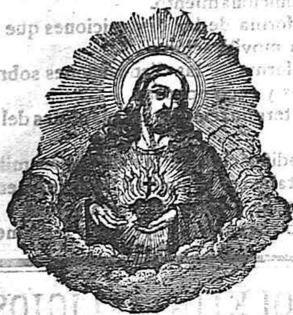
EL SAGRADO CORAZÓN DE JESÚS PEÑA DEL DESIERTO

Cada mes se celebrarán SEIS misas á intención de los suscriptores á EL ANCORÁ