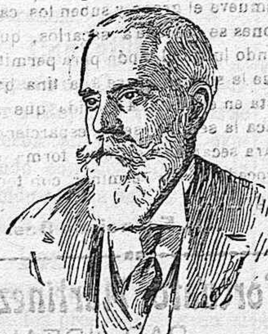
DON RAFAEL ALTAMIRA que ha sido nombrado miembro de la Comisión de la Liga de las Naciones en representación de España.