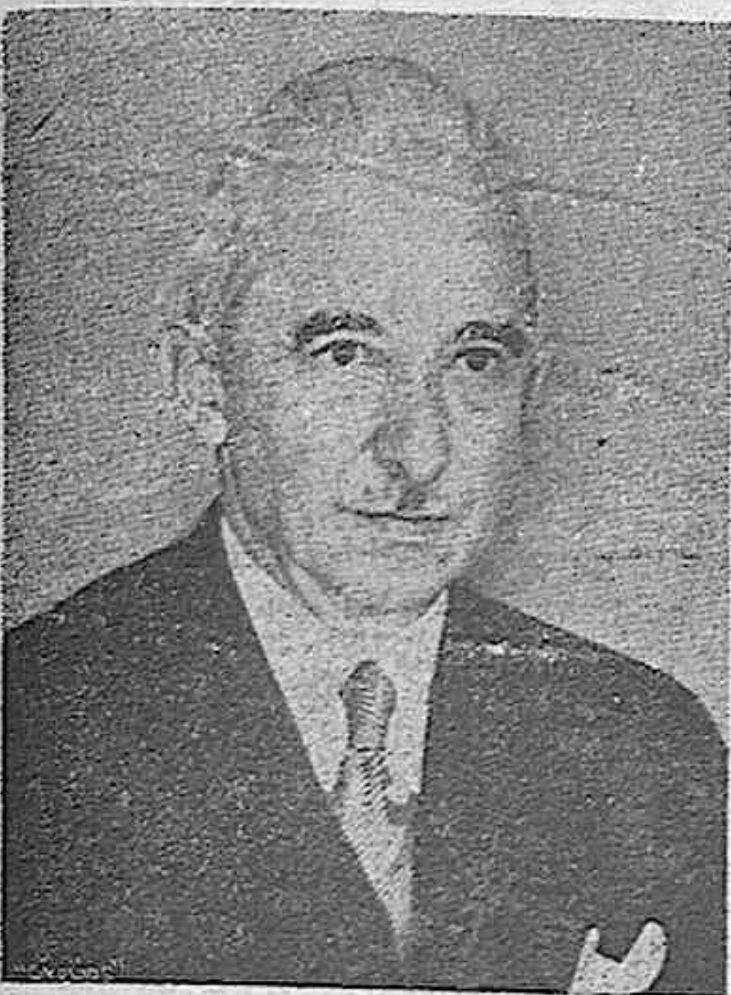
Ismet Inönü, presidente del Consejo nacional de Turquía, en torno al cual gira en estos momentos la vida diplomática de Europa