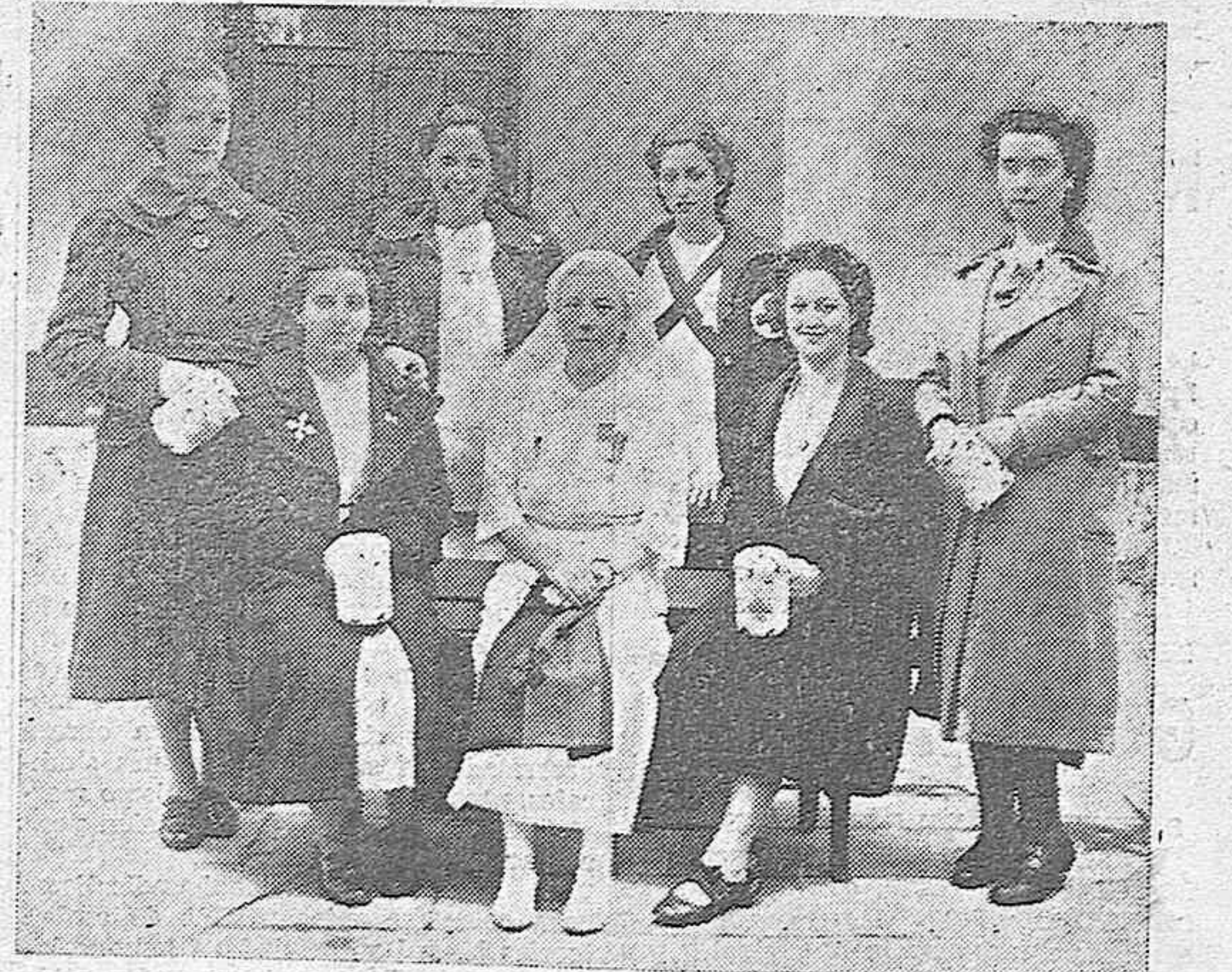
Grupo de señoritas postulantes de la Cruz Roja de Palencia que han merecido especial distinción por el éxito obtenido en sus recaudaciones. En el centro, la directora de este benemérito y patriótico servicio