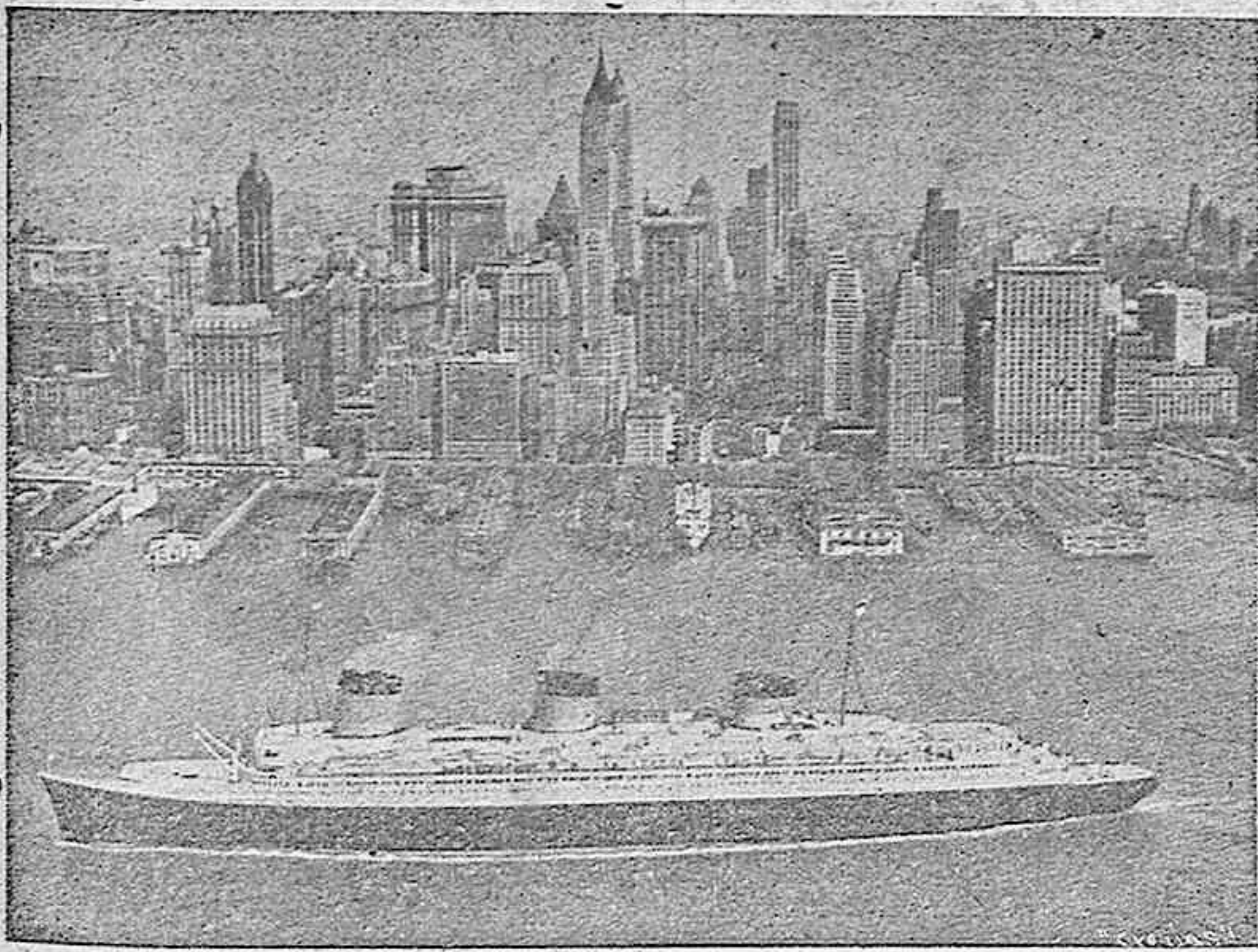
Negrín ha huido a Nueva York. Si allí no lo quieren se decidirá por Méjico. Negrín, después de robar el oro español va a esconder su responsabilidad criminal en el laberinto de la gran ciudad americana. Una interesante fotografía del lujoso «Normandie», donde viaja Negrín, saliendo de Nueva York.