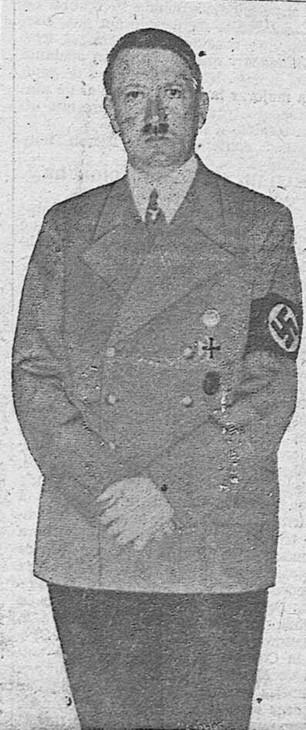
El canciller Hitler, que pronunciará hoy el trascendental discurso que aguarda el mundo entero

No considerará como respuesta el discurso de Hitler