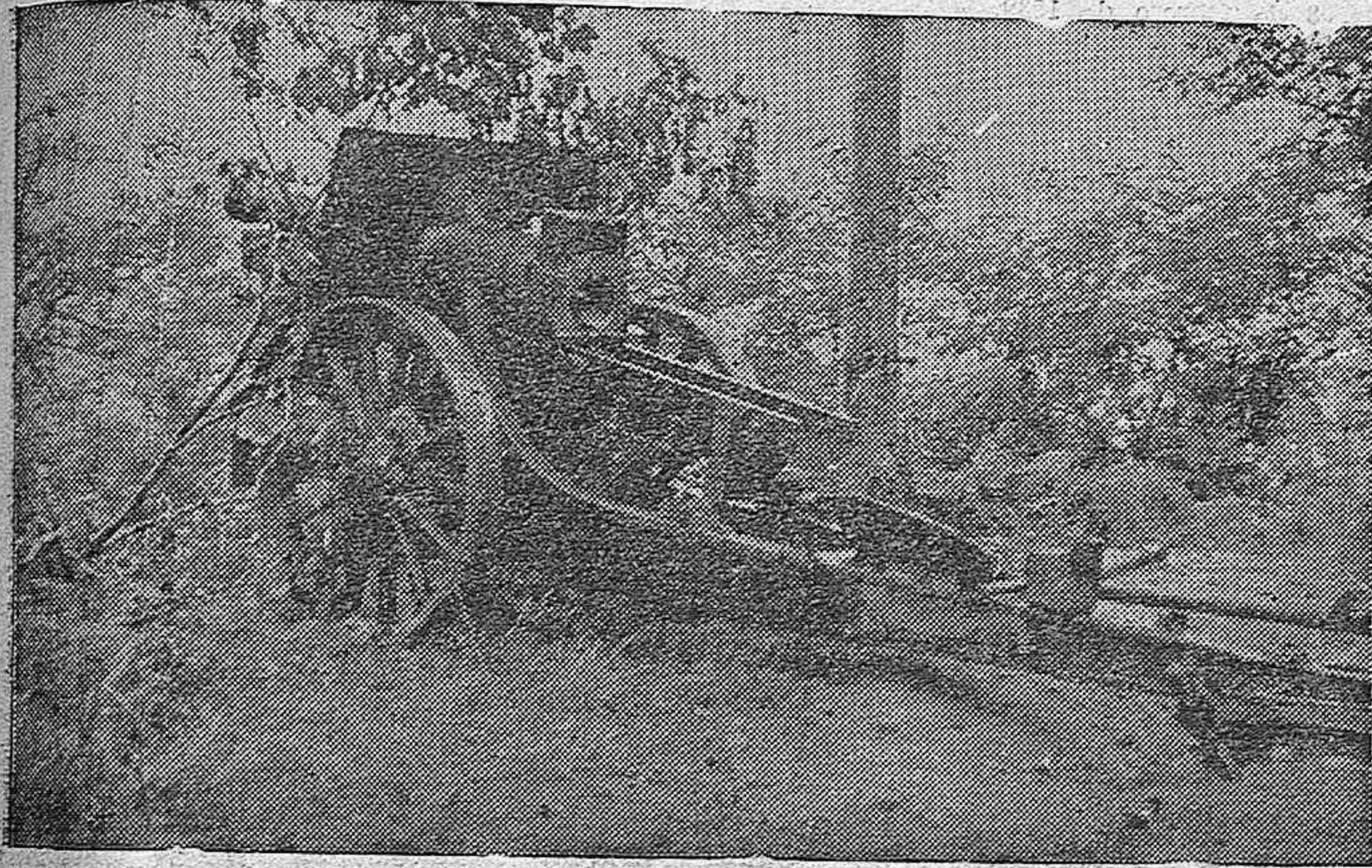
Hábilmente disimulada entre el ramaje, una pieza de nuestra gloriosa artillería bate las lomas donde se ocultaba el enemigo, pronto en huida.

Numerosas fábricas de material de guerra en nuestro poder