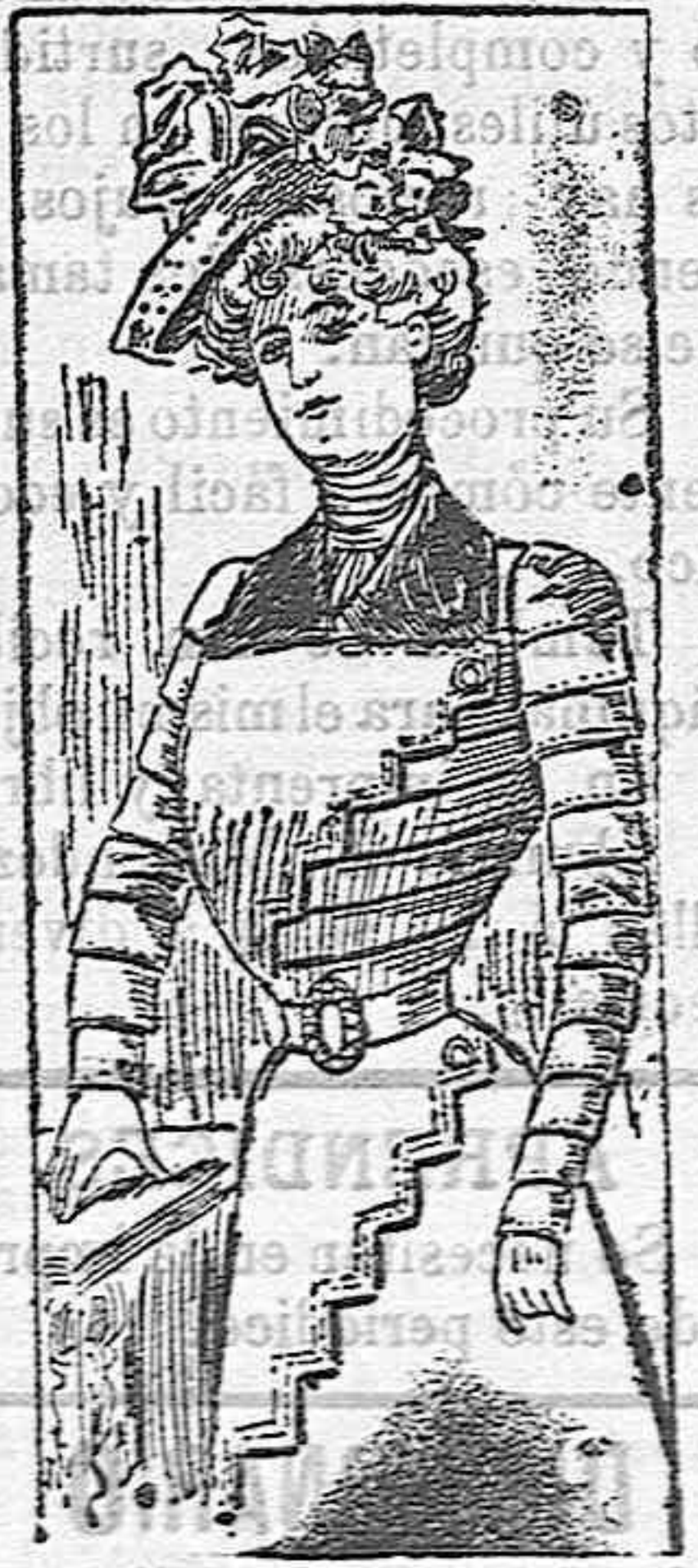
Traje para señorita

Modos exclusivos para nuestras tectoras, de los grandes almacenes de El Siglo, Barcelona.