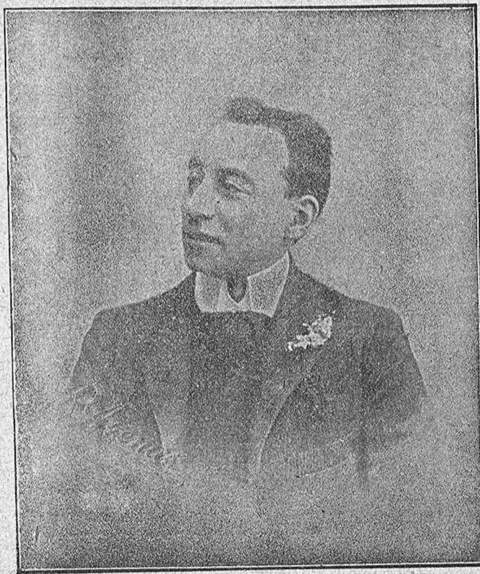
Su retrato natural.