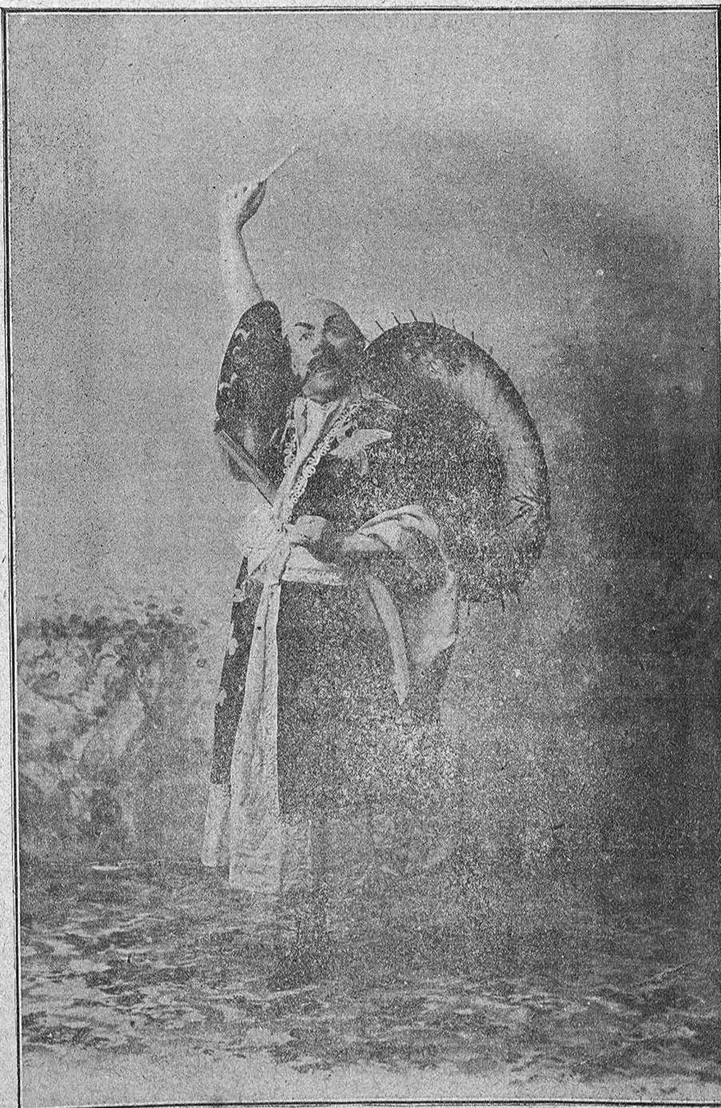
Trasformación de malabarista chino.