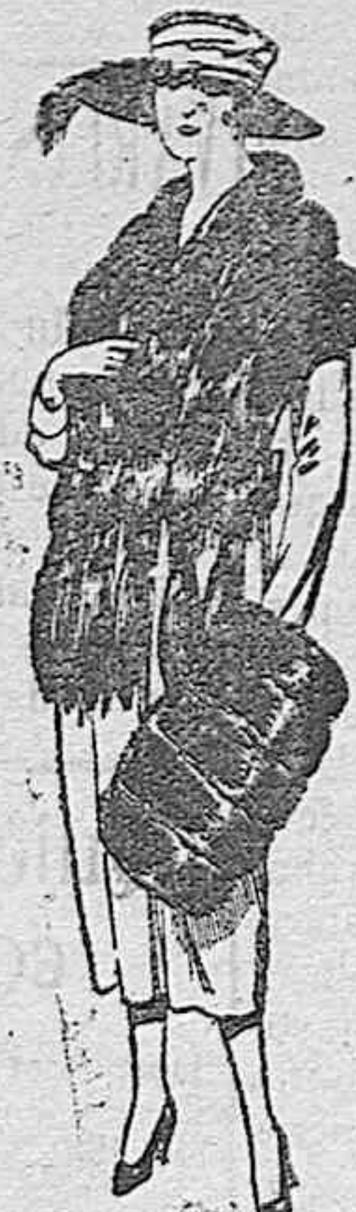
Juego pieles, imitación, «Colombia», negro de ptas. 16 a 21