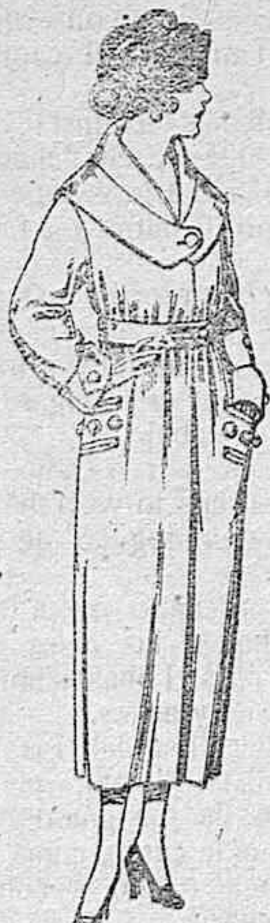
Abrigos de gamuza, pañete etc., en negro, azul y color de ptas. 45 a 90