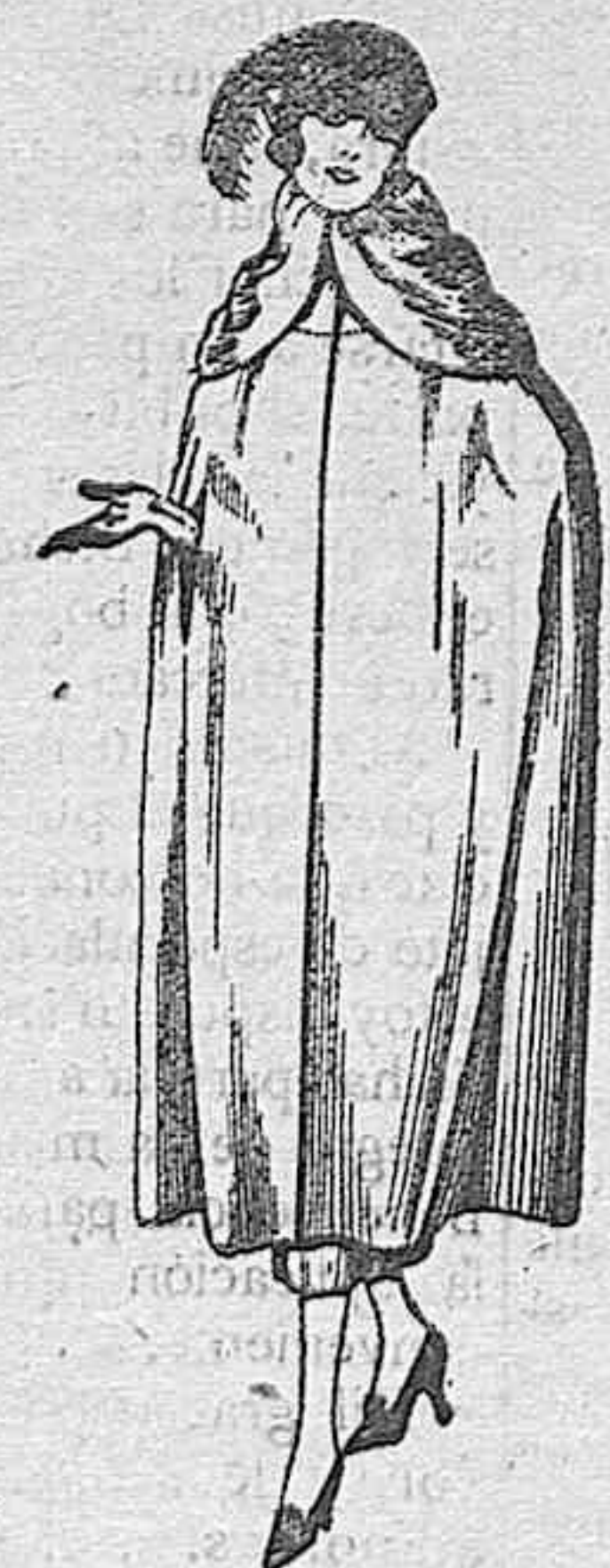
Capas de gabardina inglesa, diferentes colores de ptas. 110 a 180

Peletería, Camisería, Géneros de punto Corbatería, Guantería, Son brerería, Zapatería, Paraguas, Bastones y Artículos de viaje