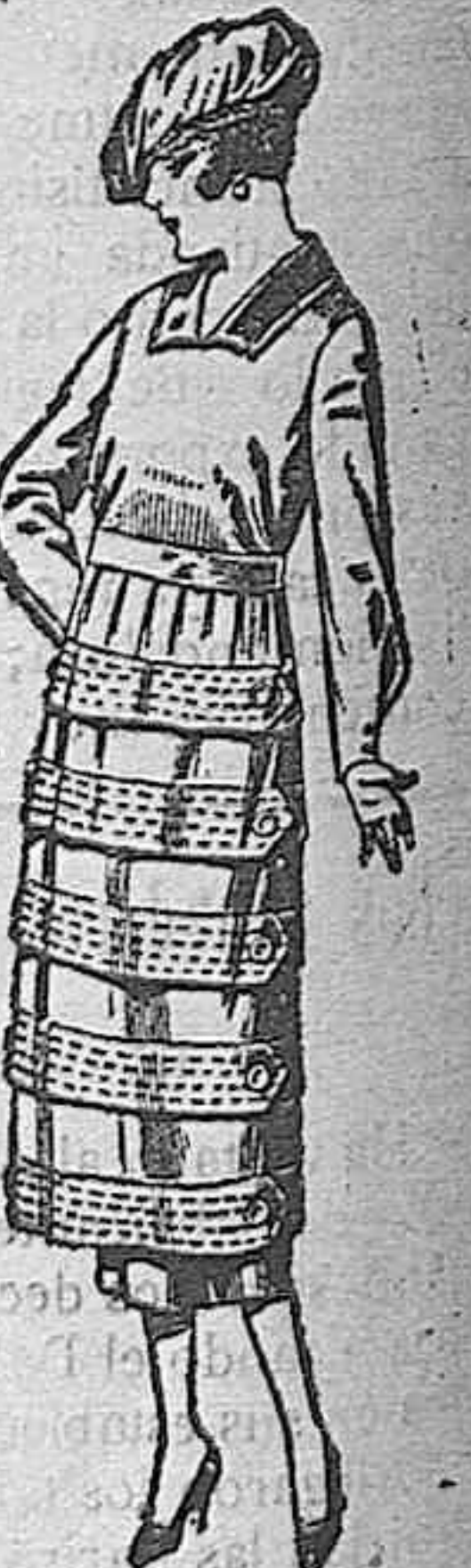
Vestidos de estambre, gabardina, sarga, etc., en negro azul y color, respuntes de adorno. de ptas. 110 a 160