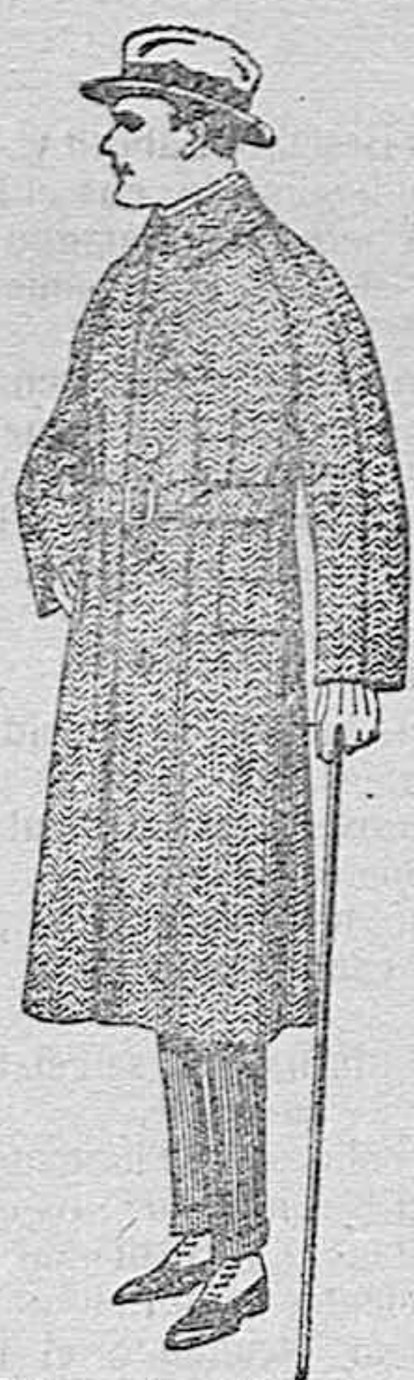
Gabanes de patén, cheviot o cower. de ptas. 85 a 120