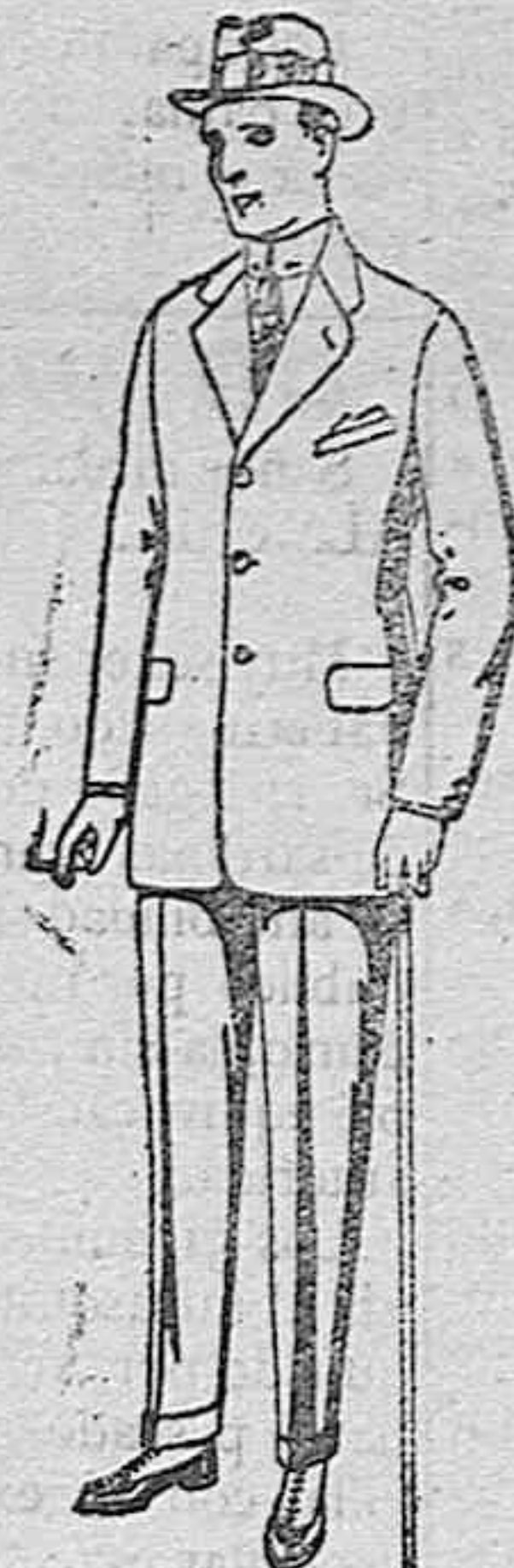
Trajes de cheviot con cinturón, elegante corte, para sportman. de ptas. 63 a 125