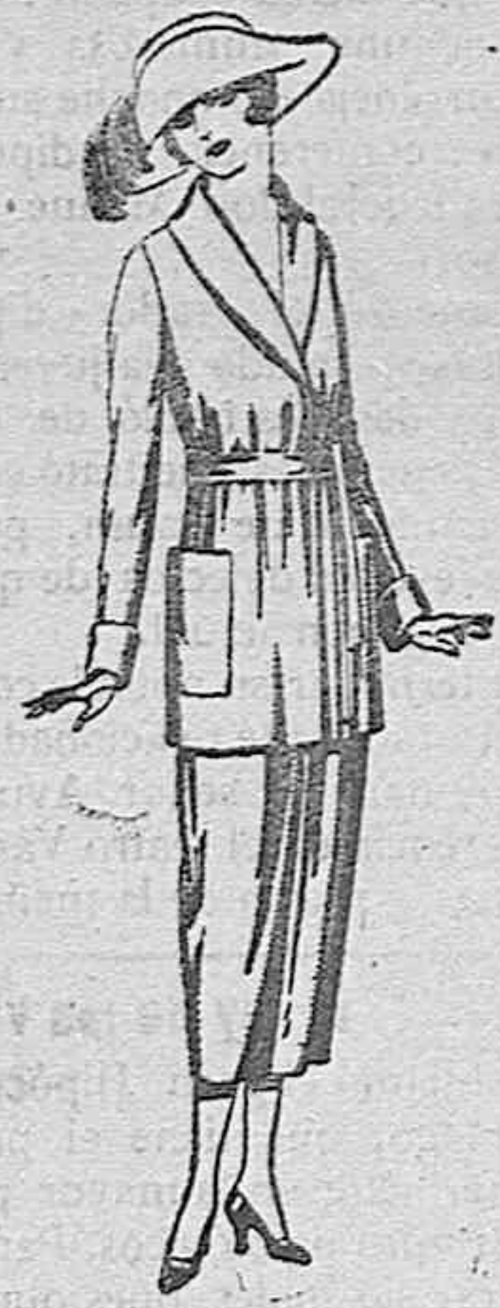
Trajes de punto de lana negro, azul y colores de ptas. 160 a 250

SUCURSALES: Madrid, Barcelona, Alicante, Bilbao, Cádiz, Cartagena, Gijón, Granada, Málaga, Palma de Mallorca, Santander, Sevilla, Valencia, Valladolid y Zaragoza