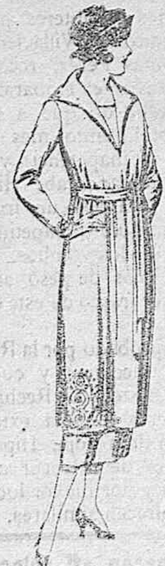
Vestidos de punto de lana, azul y color, adornos bordados. de ptas. 145 a 250