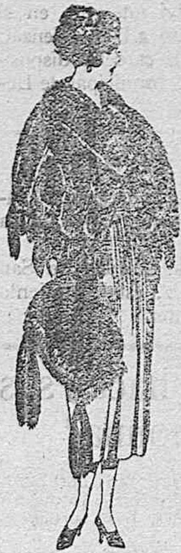
Juegos pieles, imitación Renard negro de ptas. 100 a 150