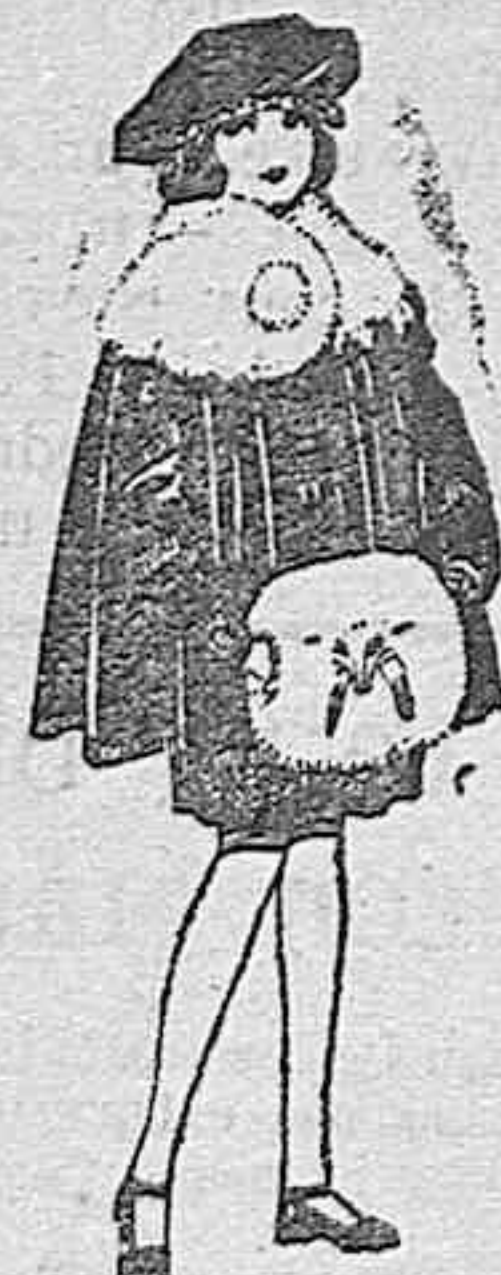
Juego de pieles blanco, imitación armiño, para niñas. de ptas. 16 a 21