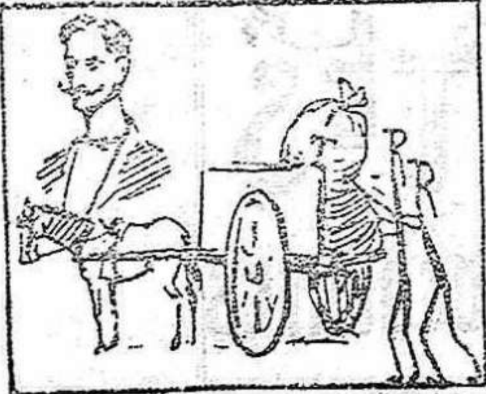
La solución mañana.