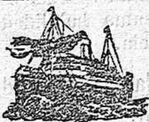
El correo trasatlántico

Vapores correos españoles de Pinillos Izquierdo y C.ª Cádiz