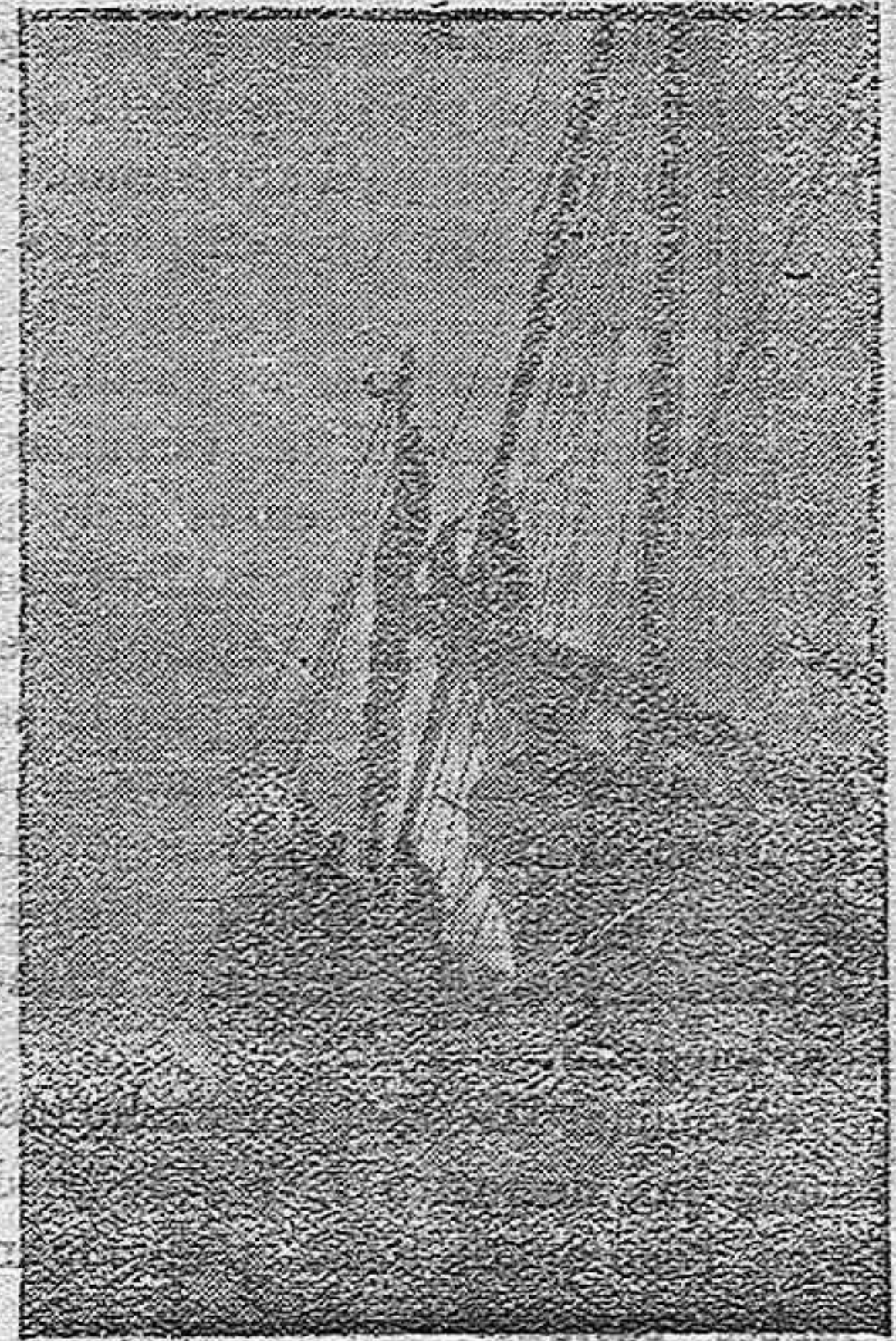
Barcos pesqueros en Salónica.