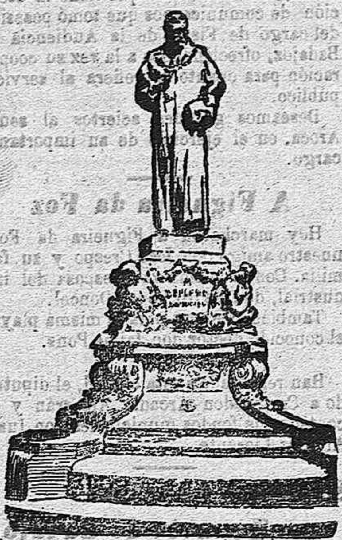
Monumento erigido a la memoria de don Eugenio Montero Rios, en la plaza de la Catedral de Santiago y cuya inauguración se efectuara durante las fiestas compostelanas