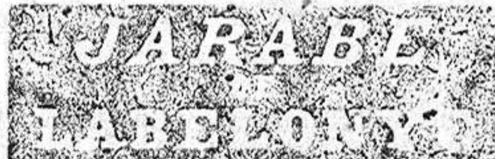
FARMACIA MODELO DE LA FACULTAD DE PARIS.