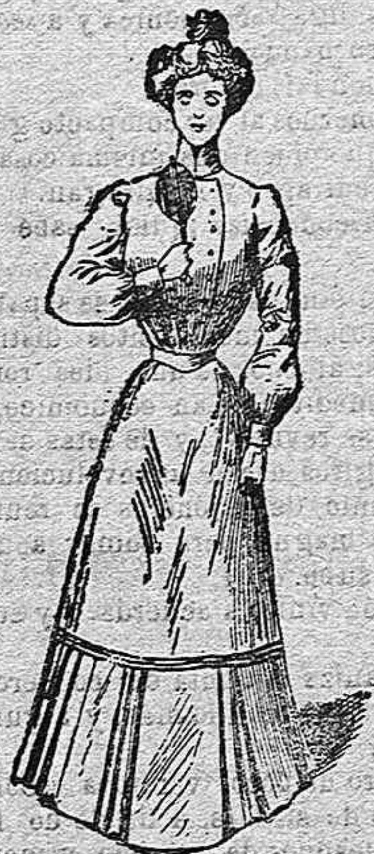
Sencillo traje para casa.

Chaqueta abrochada á un lado; dos hilos de botones. Manga ancha desde el codo á la muñeca (última manifestación de la moda). Cuello alto. Falda con volantes. Cinturón de seda del mismo color que el traje.