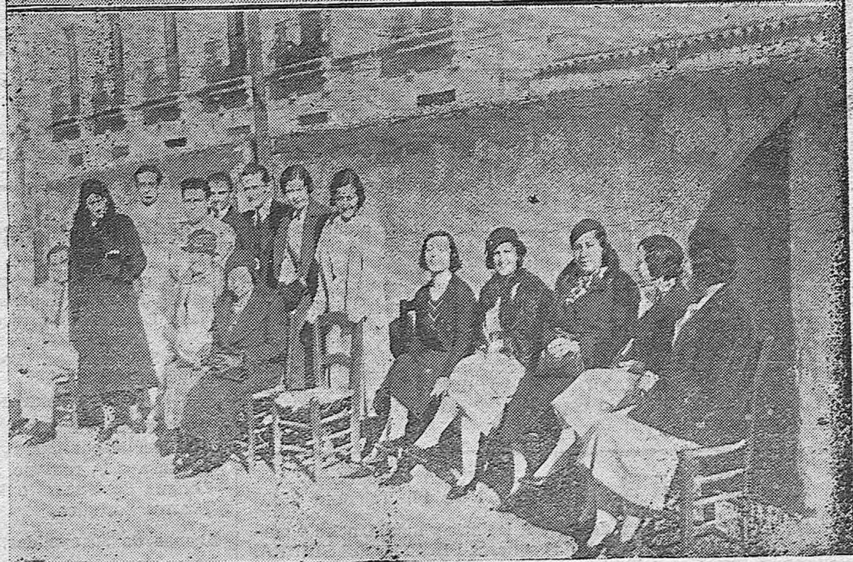
NOTAS GRAFICAS.—Grupo del equipo inglés con la selección cordobesa que tomaron parte en la jugada del domingo.—Grup o de señoritas presenciando la interesante jugada.