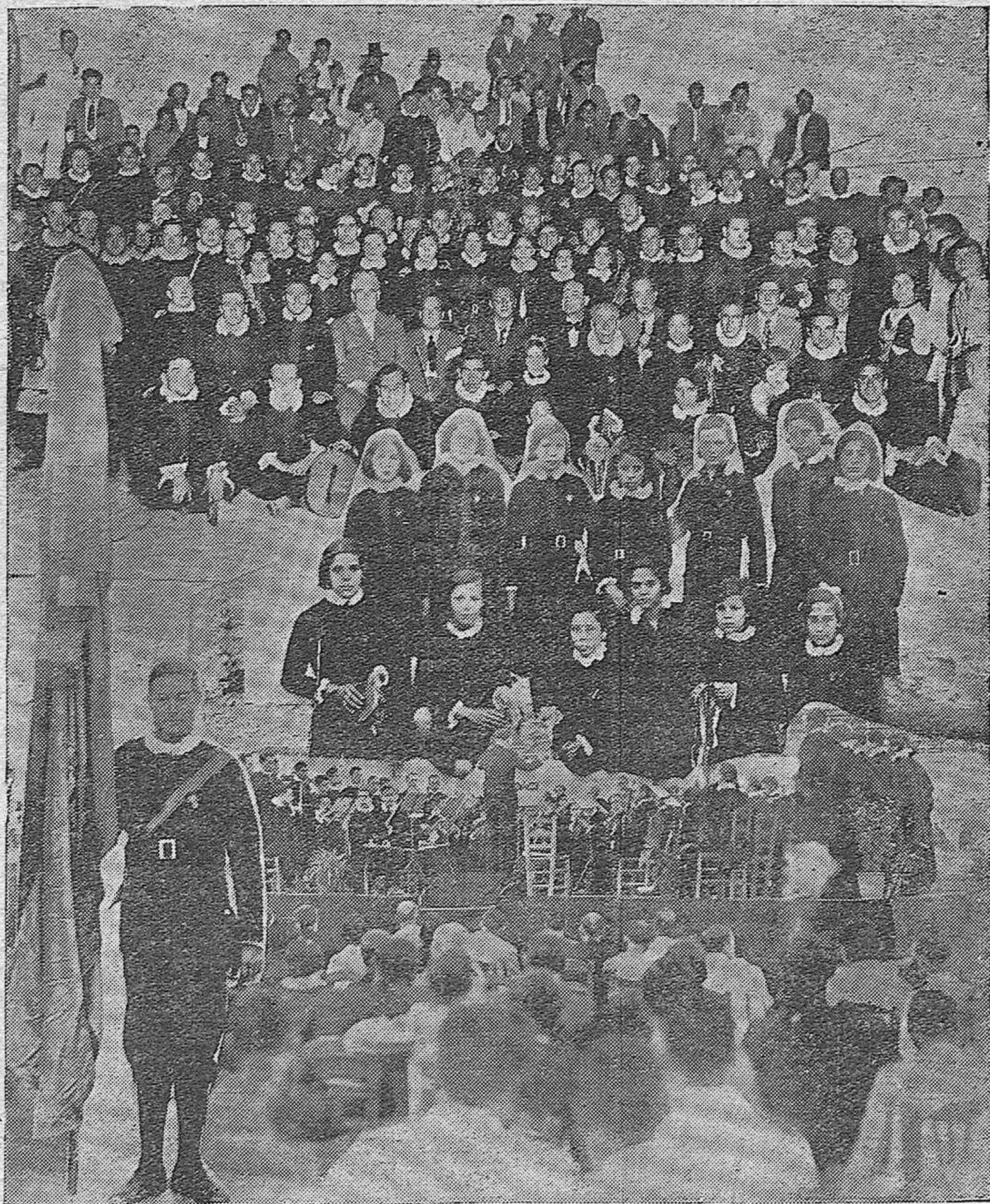
Varios detalles de la triunfal actuación artística del Centro Filarmonico "Eduardo Lucena" en la Plaza de Toros de Cabra, donde dió un concierto con motivo de la actual feria de aquella ciudad.