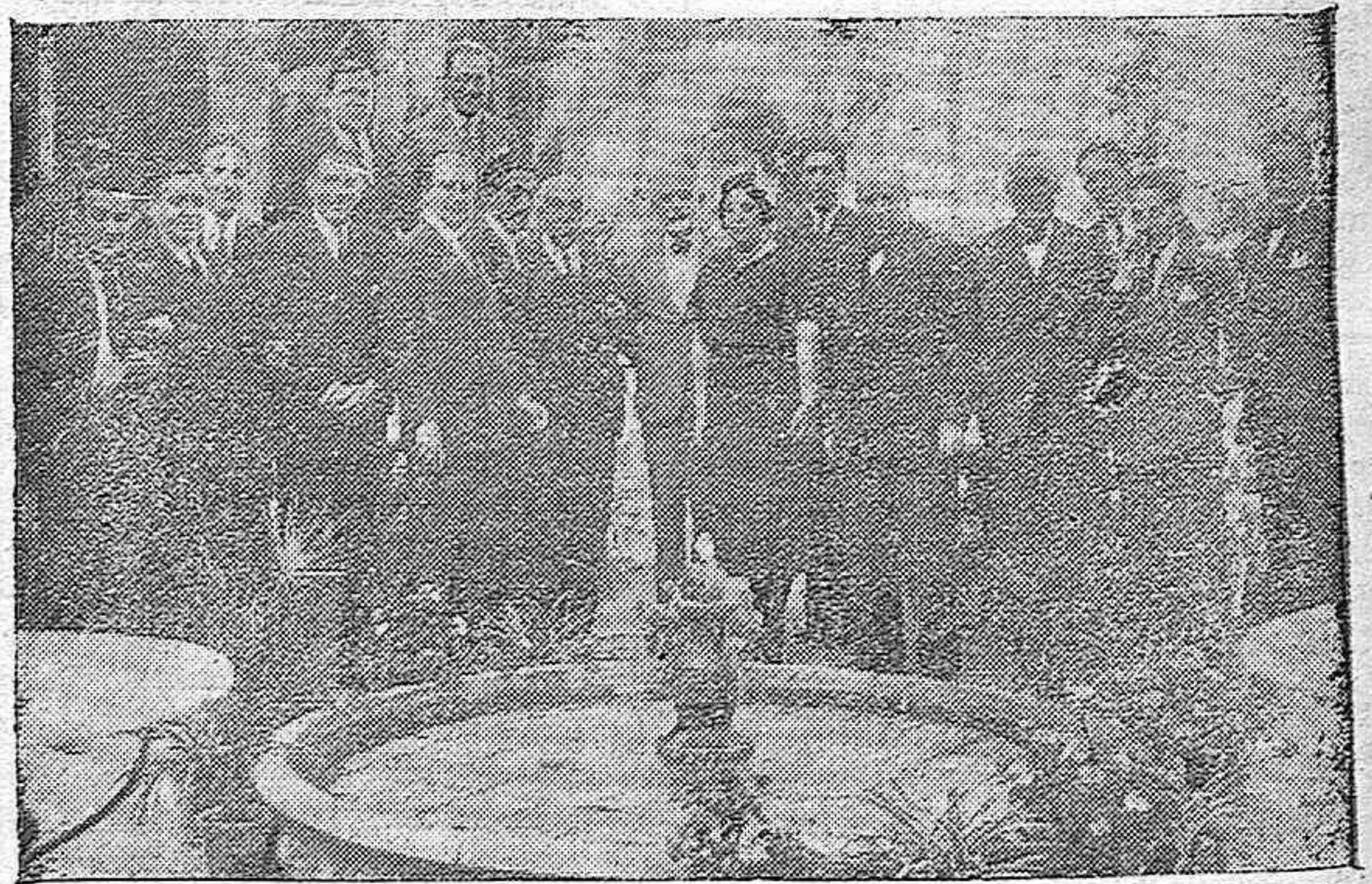
CORDOBA.—Concurrentes al almuerzo íntimo con que fué obsequiado ayer por el Ayuntamiento el Director General del Trabajo