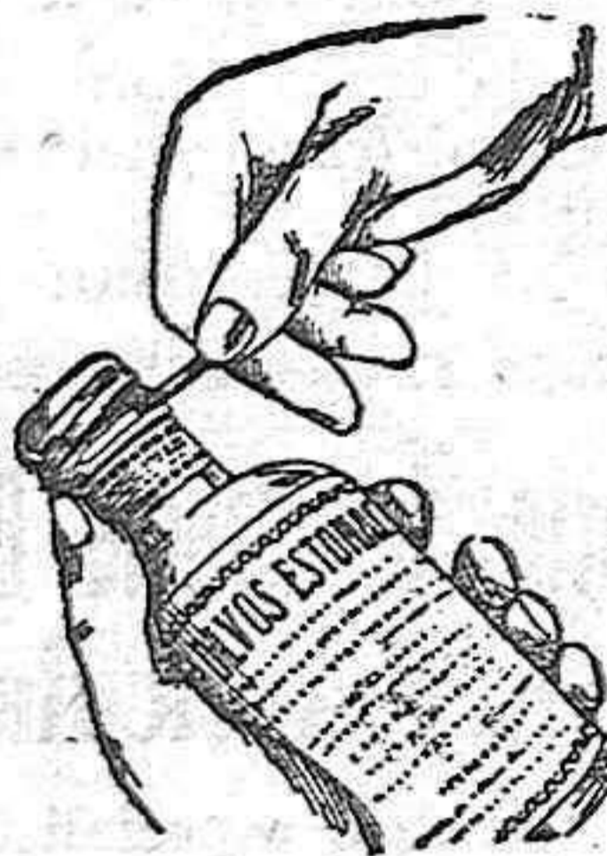
Figura núm. 3