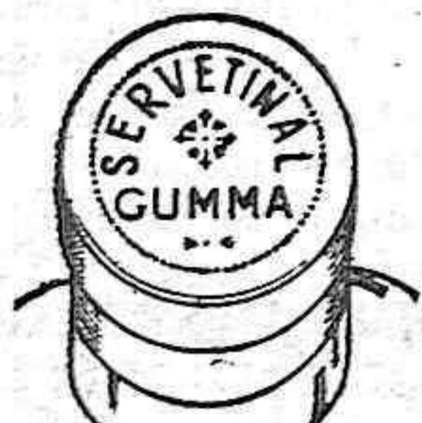
Figura núm. 1

DAMOS A CONTINUACION LAS CARACTERISTICAS DE LAS DOS CLASES DE CAPSULAS QUE CIRCULAN EN EL MERCADO