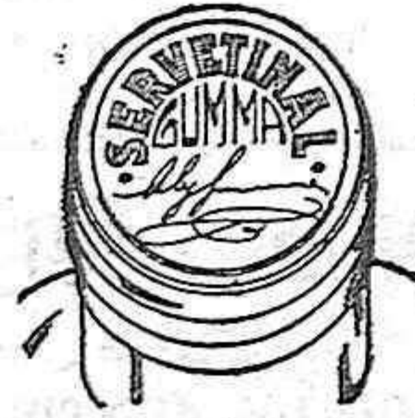
Figura núm. 2