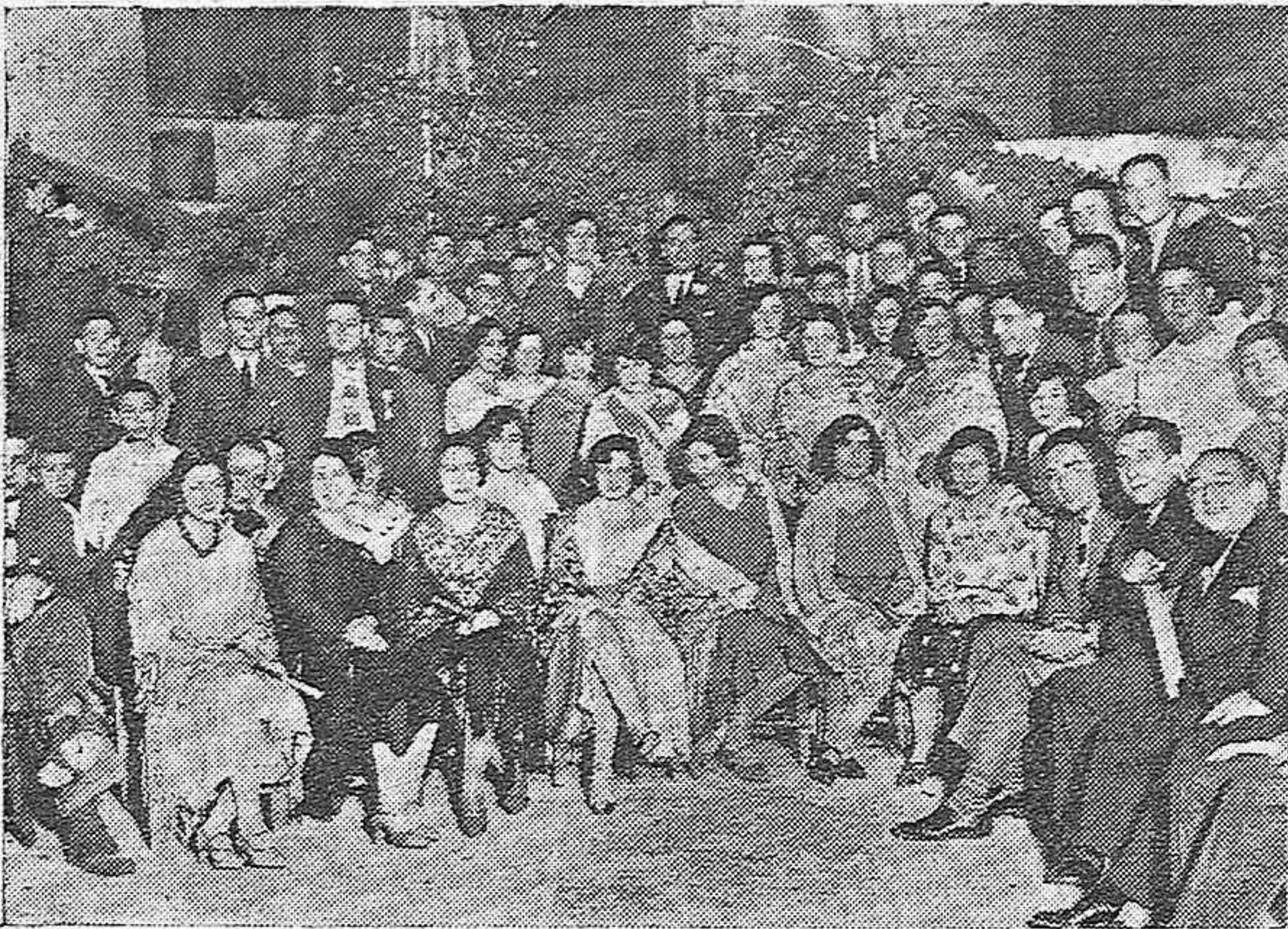
PRIEGO DE CÓRDOBA. — GRUPO DE BELLÍSIMAS SEÑORITAS Y DISTINGUIDOS JÓVENES QUE ASISTIERON A LA VERBENA DE LA VIRGEN DE BELEN