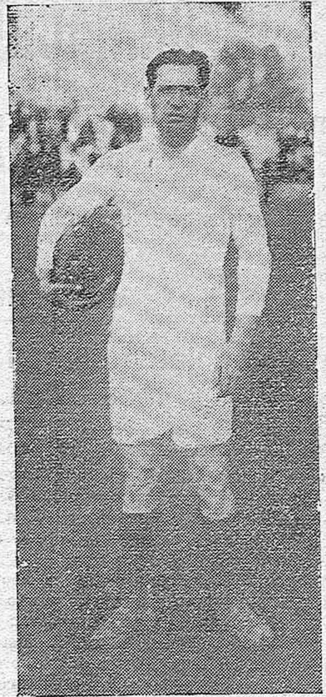
El matador de toros Antonio de la Haba “Zurito”, que actuó de centro delantero del Racing local frente al equipo torero

Todo corriente; a la medianoche, algún transeúnte retrasado que se apresura, hundiéndose la boca entre las solapas del abrigo, hacia su casa, remedando “in mente” algún compás filtrado a aquella hora por un terceto de café.