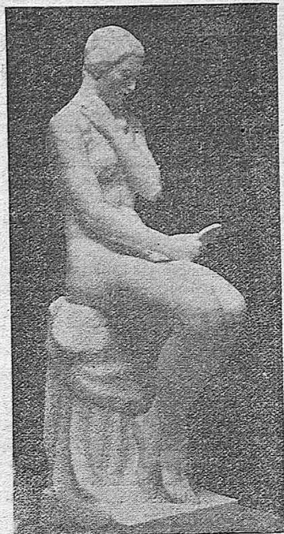
"Coqueteria", magnífico desnudo de Mateo Inurria

El desnudo mereció de Inurria singular atención. Ahí están "Pudor", "Coqueteria" y "Voluptuosidad" que decoran el vestíbulo del Casino de Madrid. Pero los desnudos femeninos de Inurria constituyen, no ya el ló-