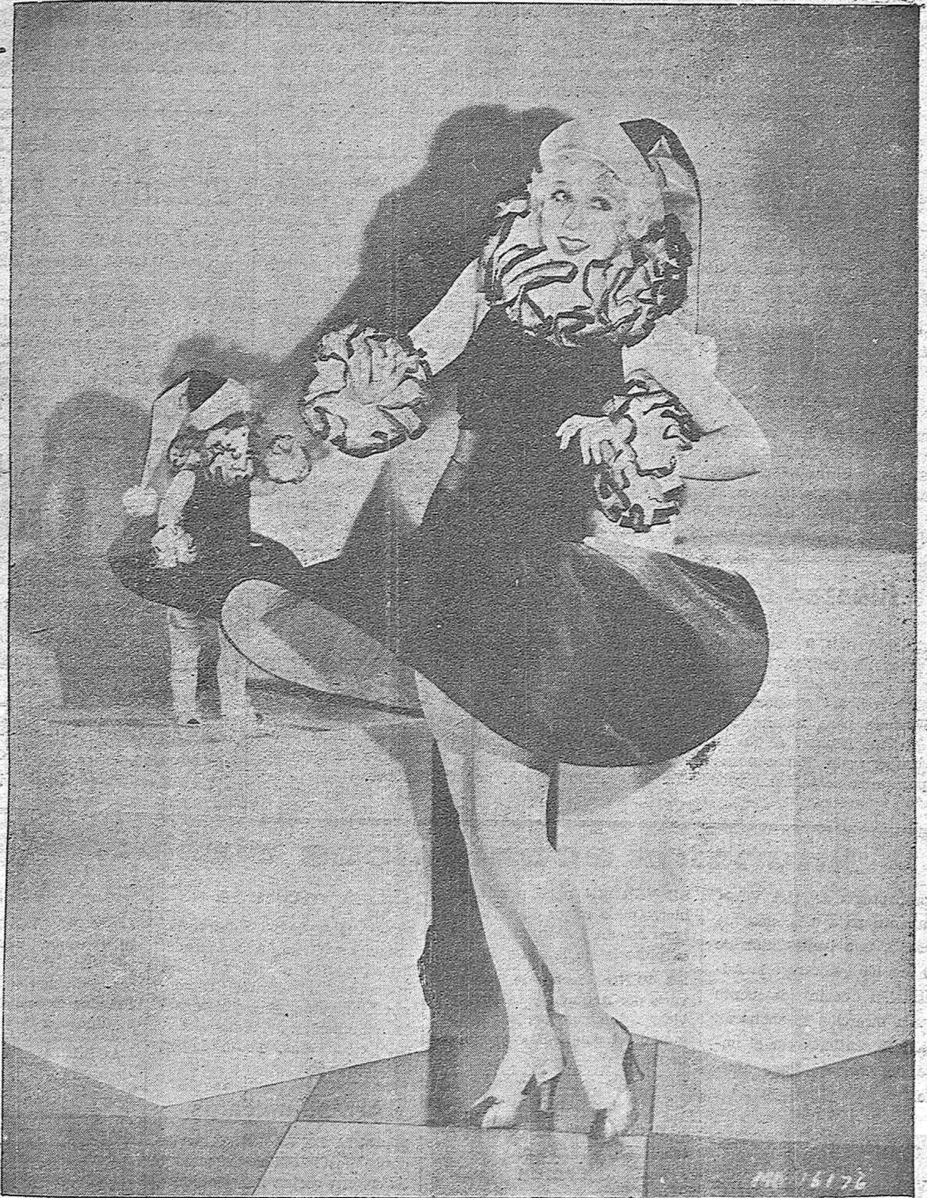
ANITA PAGE, la encantadora estrella cinematográfica en un gesto de infantilidad copia para sí el atavio de su muñeca