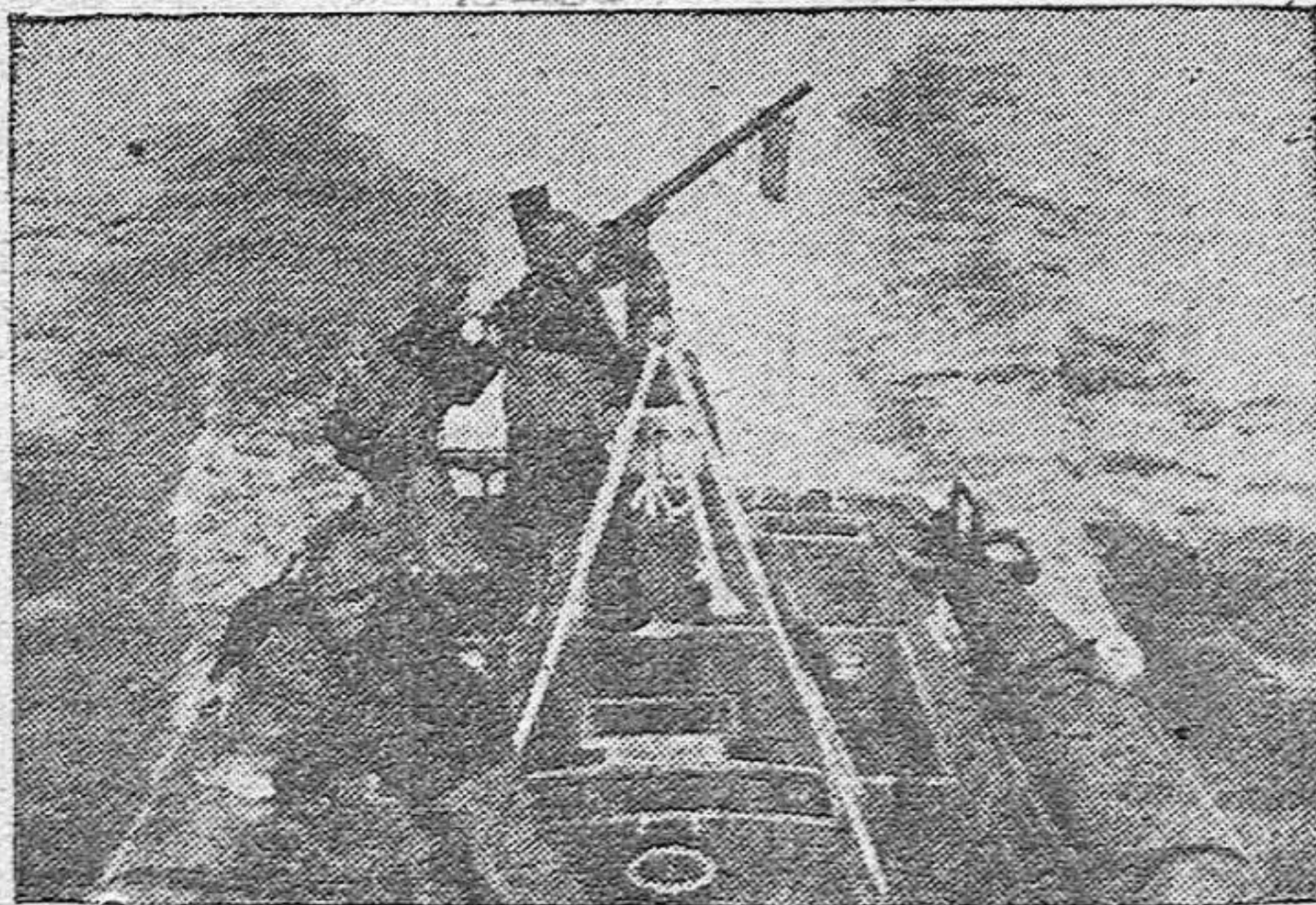
Una de las pequeñas lanchas torpederas italianas «Mas», en su actuación es importantísima estos días, dispara sus cañones anti-aéreos sobre un aparato enemigo.