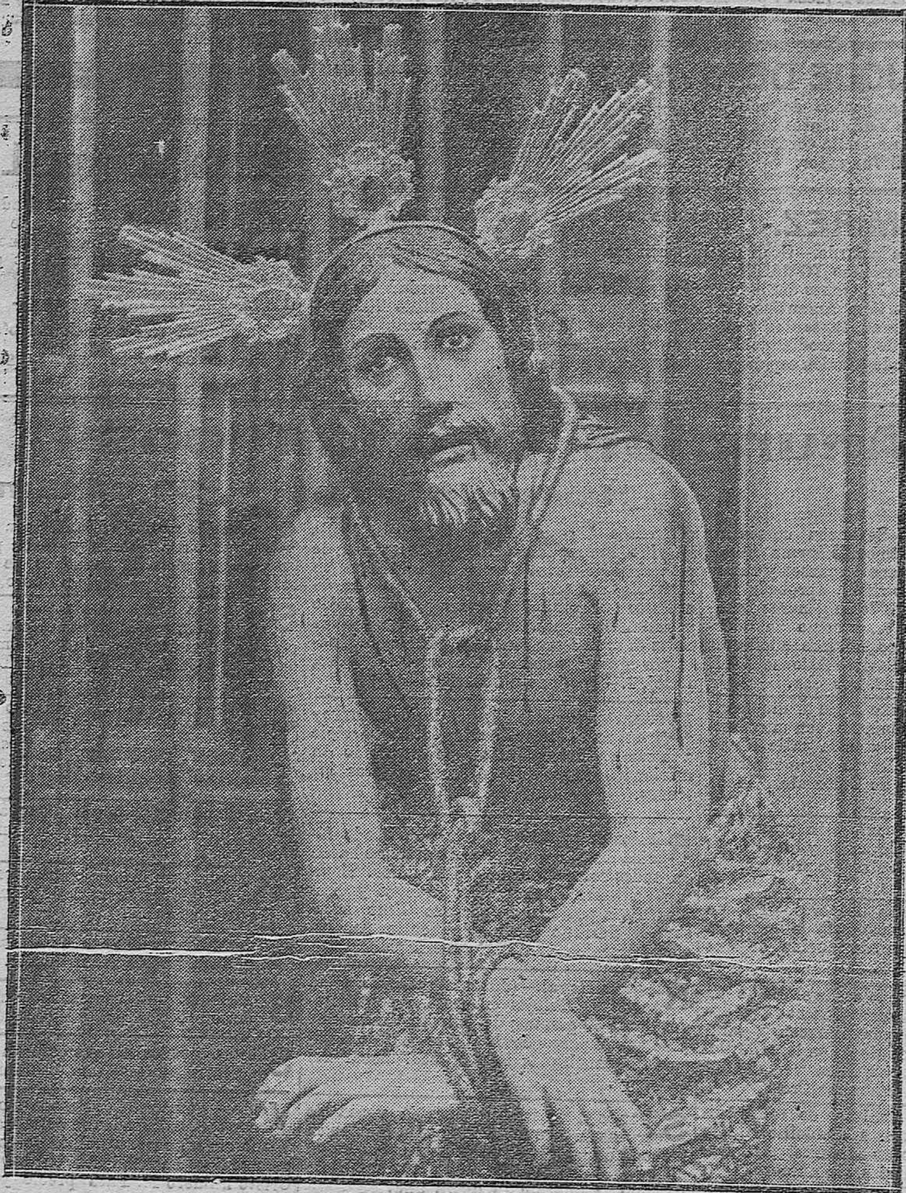
Imagen de Nuestro Señor Jesucristo amarrado a la columna, magnífica talla que se conserva en la parroquia de San Francisco y es sacada en la procesión del Santo Entierro.