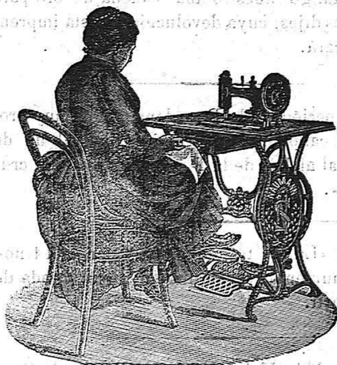
Nuevo, Práctico Higiénico