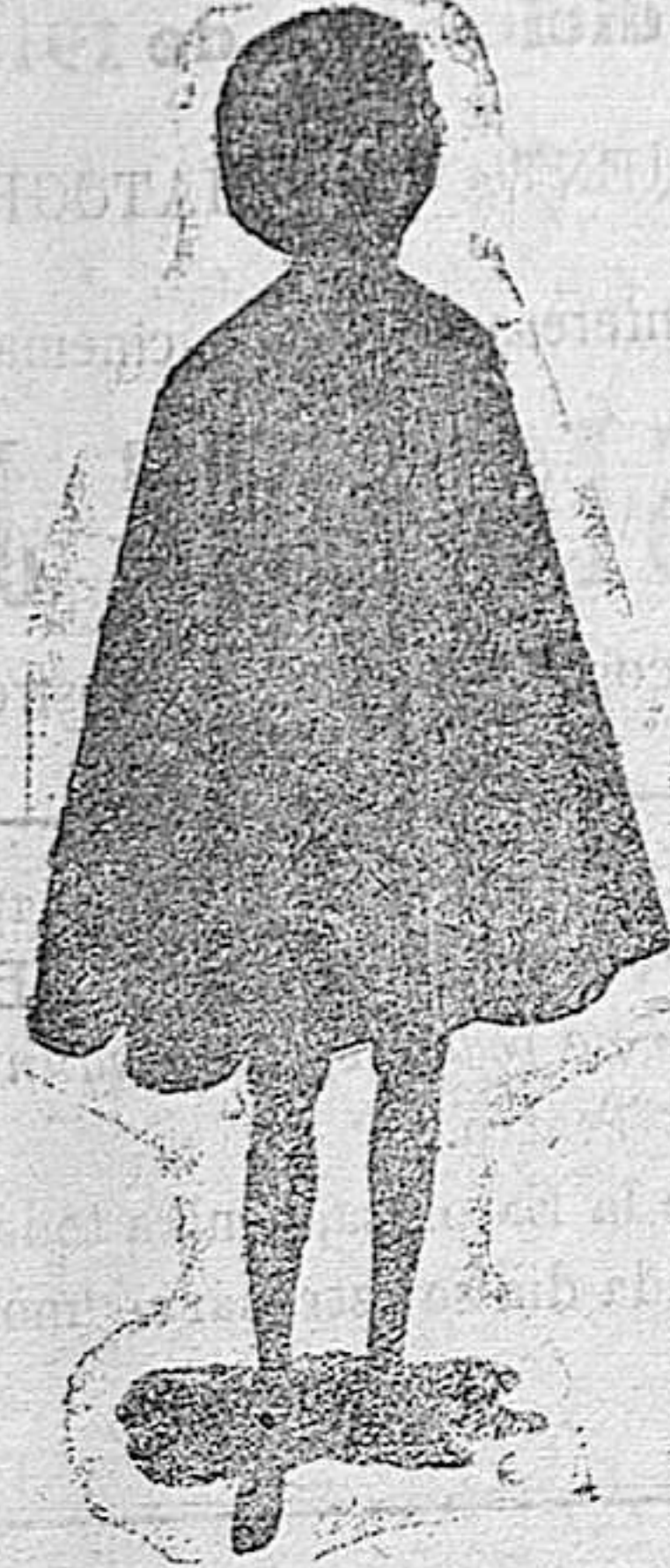
CAPITAS IMPERMEABLES para niños y niñas desde pesetas 9 a 20

Impermeables Gabardina y fuertes para el campo.