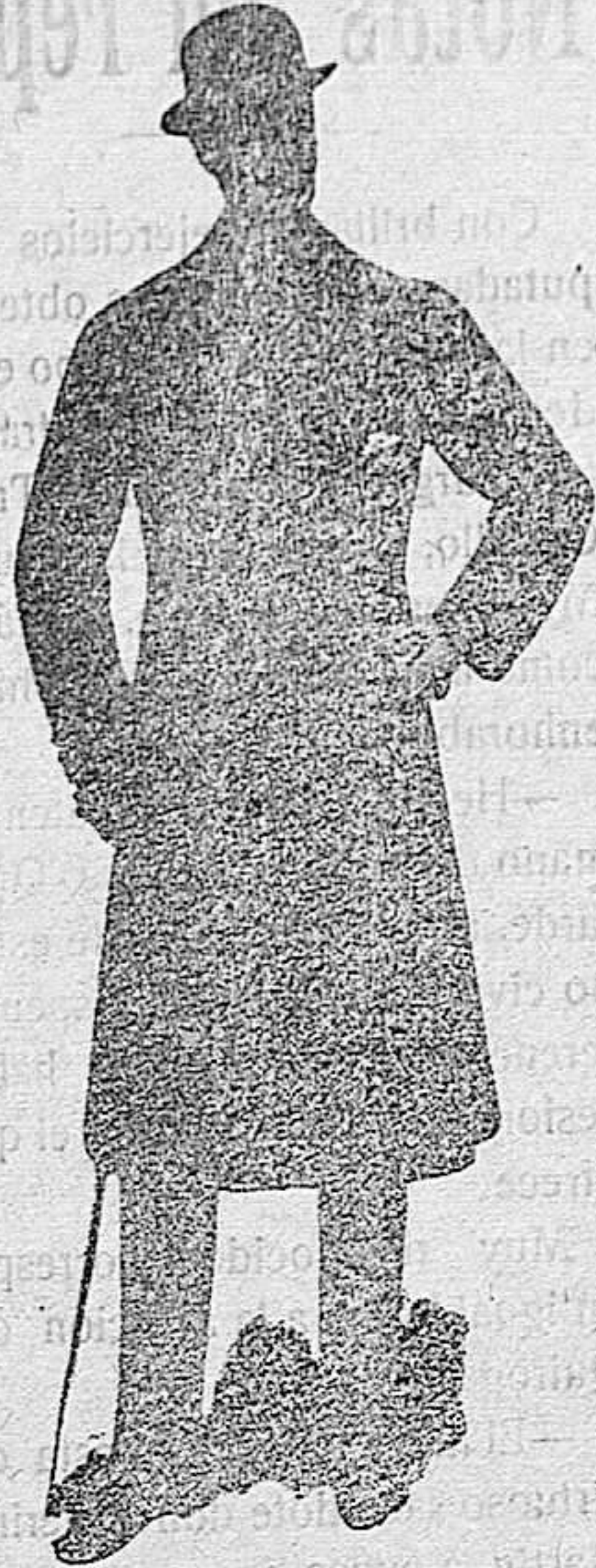
GABANES de Paño melitón a 80 ptas.

Impermeables Gabardina y fuertes para el campo.