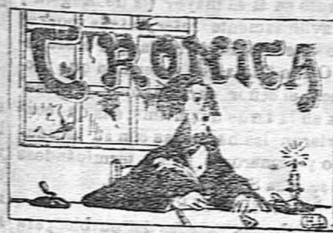
La vida anecdótica