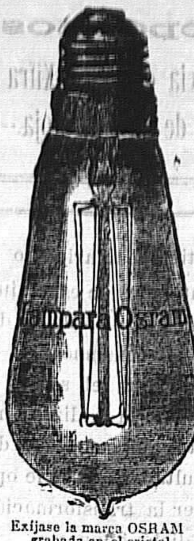
Exija la marca OSRAM grabada en el cristal

COMPOSICIÓN N.º.—R. Glucirrina 4, Milax 4, Rheum 2, Chincolina 2, Cascarilla 1, 2, Pops. 0'1 C. Apololina 0'05, Terchirrina 0'10, Tricitum 65, Acid. Benzoic. 0'01, R. Hipofosfito. Sal de Pe 0'60 Margensa 0'20, Ferrosa 0'10, Nux vomica 0'01.