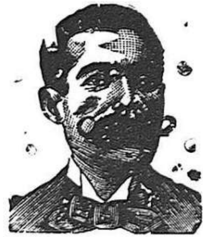
A. Salvati Costanzi Diputación, 435, Barcelona

Dirigirse al representante general y único de la Sociedad Oro y Brillantes. Am: Alaska, G. A. Buysas, Corso Romana, 104 y 106, Milan (Italia).