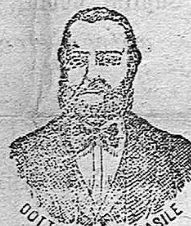
Dr. NICOLA CASILE Inventor de los renombrados medicamentos CASILE.

han logrado que el Dr. Casile de Nápoles descubriera los milagrosos medicamentos que curan infaliblemente la tisis en cualquiera de sus periodos y todas las enfermedades del estómago. A la más pequeña manifestación de un resfriado, tos, catarro, bronquitis, gripe, asma (sefocación), espectoración y de cualquier enfermedad del pecho, tomar inmediatamente las PERLAS CASILE, que no sólo curan infaliblemente estas enfermedades, sino que se tendrá la completa seguridad de no contraer otras mucho más graves. Siguiendo este método se podrá decir no más tisis.